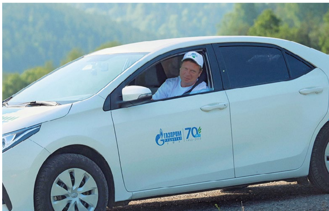
Путешествие с заботой о природе