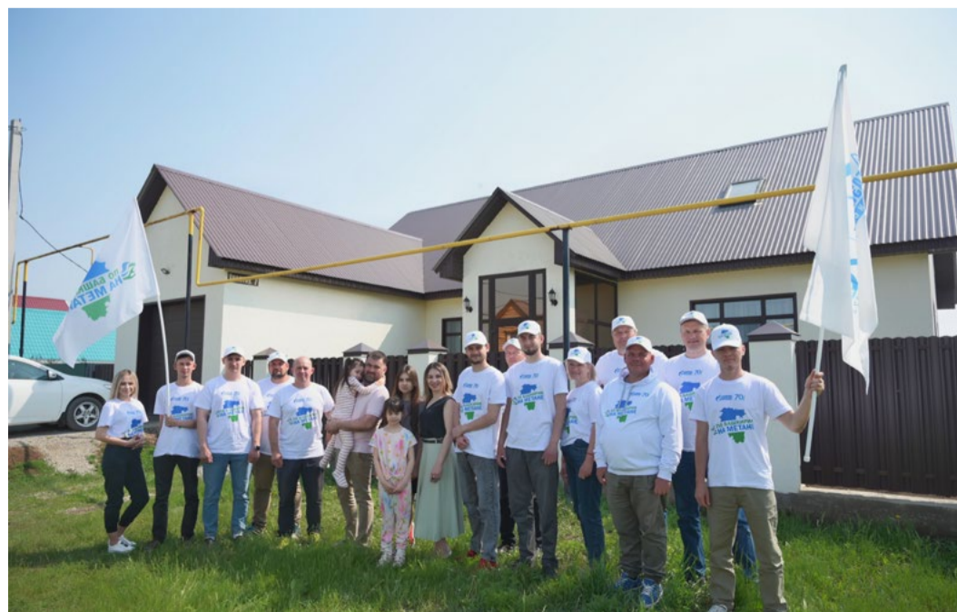
Газотранспортники ознакомились с ходом реализации масштабной программы догазификации

Эльвира КАШФИЕВА.