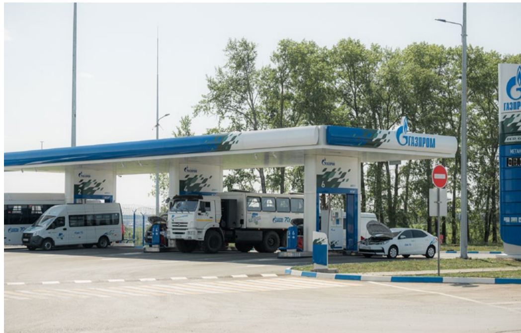
Заправка техники на АГНКС Кармаскалы