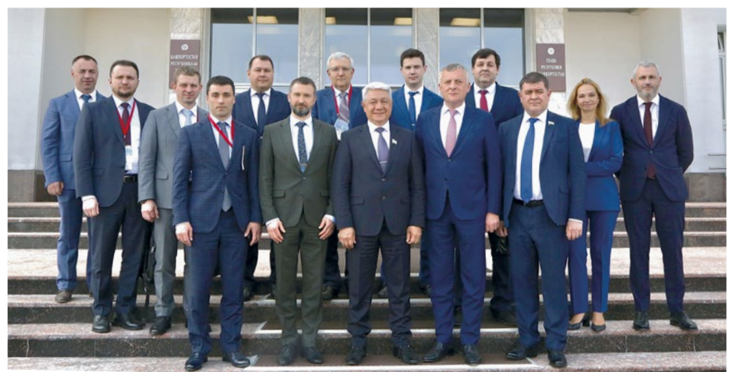
Участники заседания по вопросам взаимодействия Башкортостана с организациями «Газпрома»

– Мы ведем активную работу по развитию газомоторной инфраструктуры, строим автомобильные газонаполнительные компрессорные станции. Их уже 51. Продолжаем работу по переводу транспорта на газ. Укрепляется кооперация «Газпрома» с системообразующими предприятиями Башкортостана. С «ОДК-УМПО» завершена реконструкция компрессорных станций ООО «Газпром трансгаз Уфа» путем установки газотурбинных двигателей АЛ-31СТ, продолжается разработка двух опытных образцов двигателя АЛ-41СТ. В Стерлитамакском районе «Газпром СПГ технологии» будет строить первый в республике комплекс по производству и отгрузке сжиженного природного газа. Предоставлен земельный участок, работы выходят в стадию «на земле». Общий объем инвестиций предприятий «Газпрома» в республику за прошлый год составил порядка 34 млрд рублей.