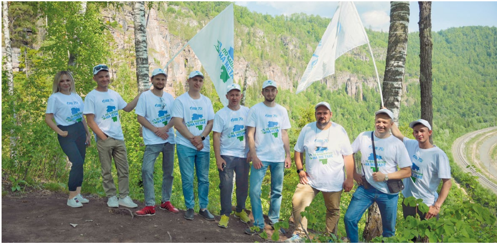
На Розовых скалах

В дни проведения крупного отраслевого форума в республике состоялся традиционный автопробег «По Башкирии на метане». В этом году он был приурочен к знаменательным датам предприятий корпоративной ассоциации.