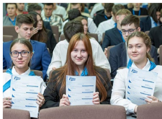
К диктанту готовы!