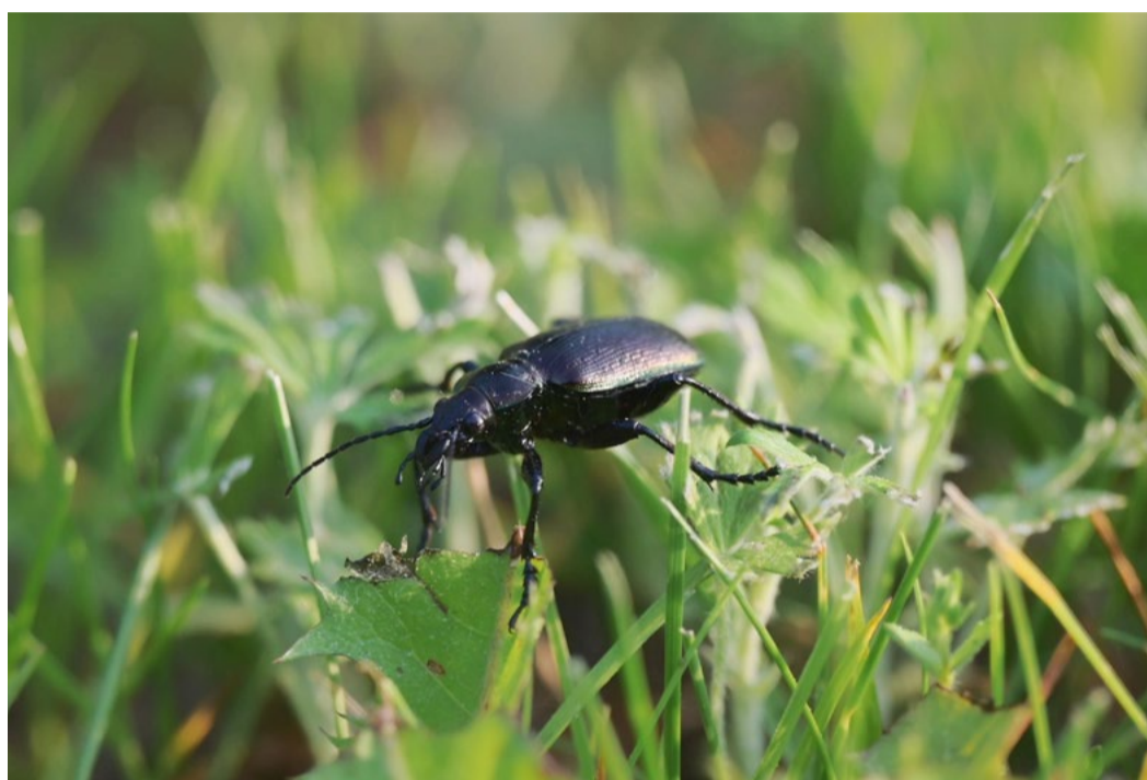
Красота в глазах смотрящего