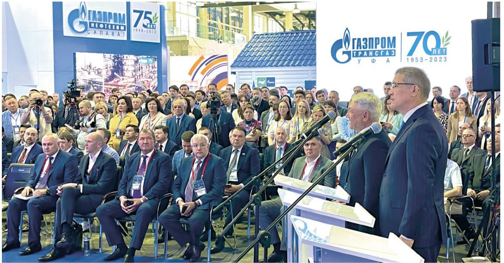
Старт международной выставке дан!