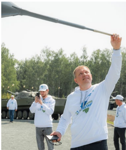
Музей военной техники в парке «Патриот»

Знойный, сочно-зеленый, с пряными ароматами башкирского разнотравья и щедрый на туманные рассветы – это все по-настоящему летний май, который застали работники ООО «Газпром трансгаз Уфа» в самых живописных уголках республики. Когда любишь путешествовать и выбираешь для этого экологически чистое топливо, приходит осознание полного единения с природой!