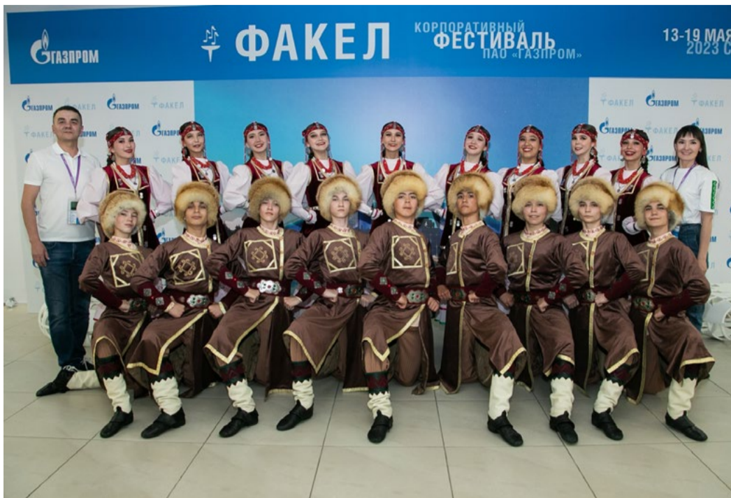
Образцовый хореографический ансамбль «Далан» покорила сцену «Факела»