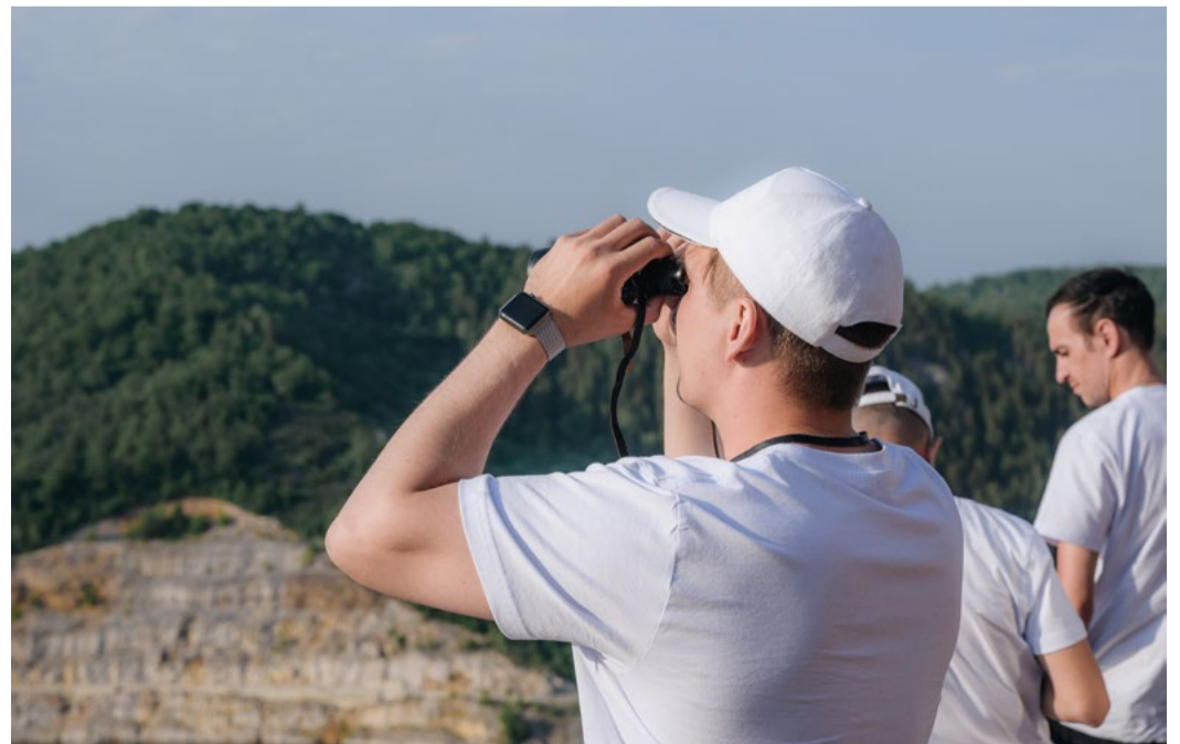
Любуясь пейзажами родной республики

Автопробег завершился экскурсией в ООО «Газпром нефтехим Салават», которое в этом году отмечает 75-летие. Участники осмотрели новые производства, введенные в компании с 2012 года в рамках программы модернизации нефтеперерабатывающего завода: установку первичной переработки нефти ЭЛОУ АВТ-6, установку короткоциклового адсорбции, новый комплекс каталитического крекинга. Они увидели сердце завода «Мономер» – производство этилена-пропилена