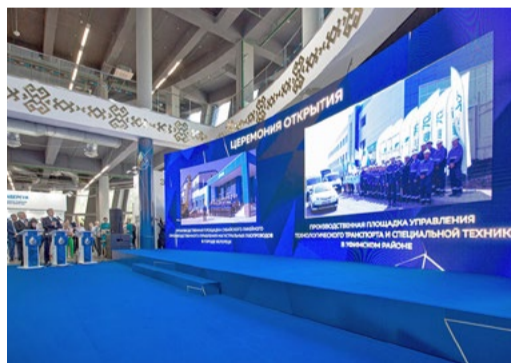
Ввод в эксплуатацию новых объектов в режиме телемоста

В Уфе прошло заседание межведомственной комиссии по вопросам взаимодействия Башкортостана с организациями «Газпрома». Глава региона Радий Хабиров отметил, что в республике достигнуты хорошие результаты в сфере социальной газификации. С 2021 года газ доведен до границ 32,5 тысячи домовладений.