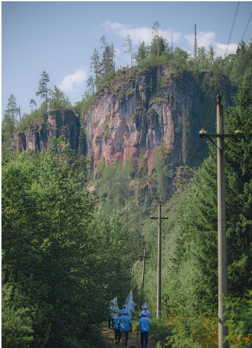
В общей сложности работники преодолели порядка 25 километров пешего маршрута

ЭП-355, а также ознакомились с ходом реализации инвестиционного проекта по производству технической серы, направленного на улучшение экологии.