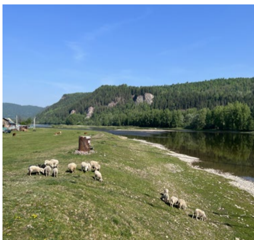
Д. Бриштамак, Белорецкий район

Для того, чтобы попасть сюда на автомобиле, нужно доехать по красивой трассе Уфа – Белорецк до деревни Бриштамак. Далее – пешком вдоль железной дороги. Электрички курсируют не так часто, поэтому прогулка совершенно спокойная и комфортная. Между прочим, рядом с Розовыми скалами выходят на поверхность многочисленные источники минеральных вод. Именно на их базе и построен один из самых известных в Башкирии санаториев. Любой местный житель подскажет, как найти целебный колодец.