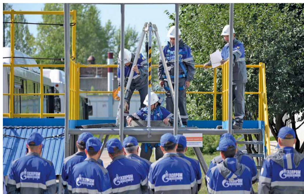
Участникам предстояло пройти комплекс заданий, связанных с реальными ситуациями на производстве

В ООО «Газпром трансгаз Уфа» состоялся конкурс «Лучший уполномоченный по охране труда», который ежегодно проводится профсоюзной организацией. 40 участников из всех филиалов предприятия преодолели пять этапов испытаний, состоящих из теоретических и практических заданий.