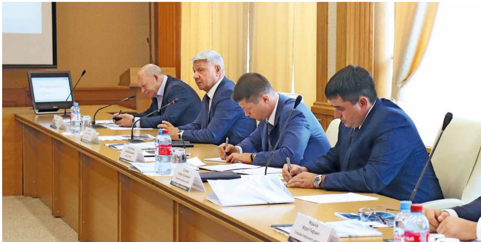
Участники совещания обсудили перспективы двигателя АЛ-31СТ

Лиана ЗИЯТДИНОВА.