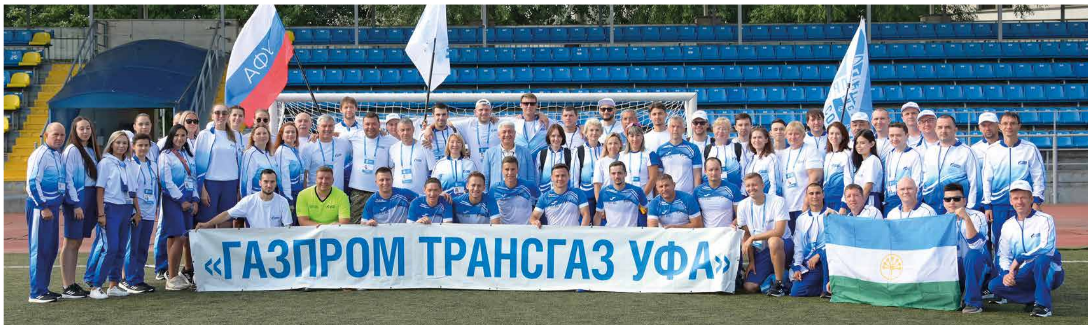
Делегация ООО «Газпром трансгаз Уфа» на Спартакиаде ПАО «Газпром»