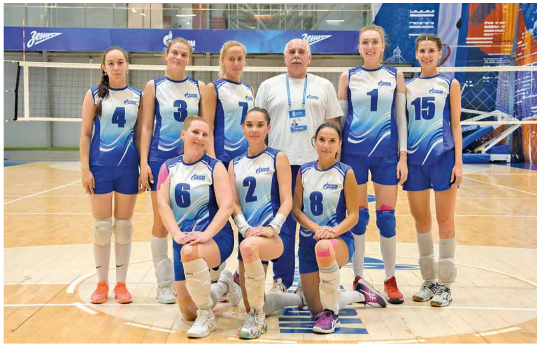
Женская команда по волейболу