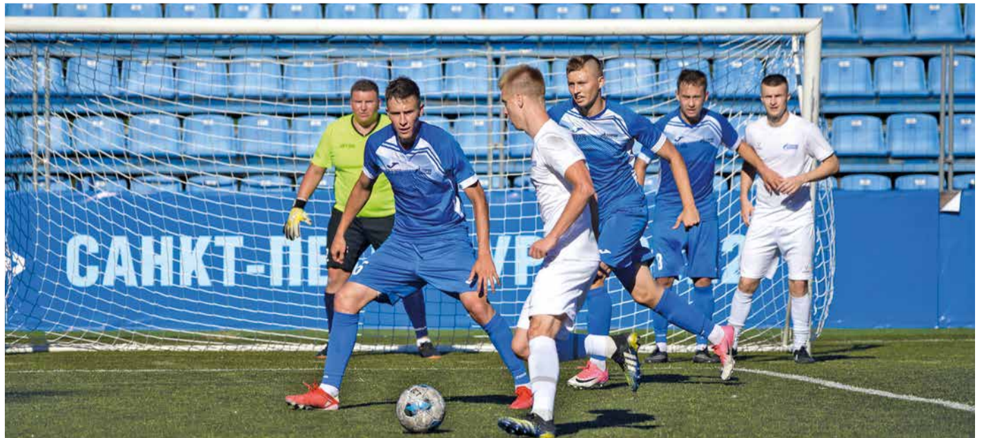
На легендарном стадионе «Петровский» прошли футбольные матчи