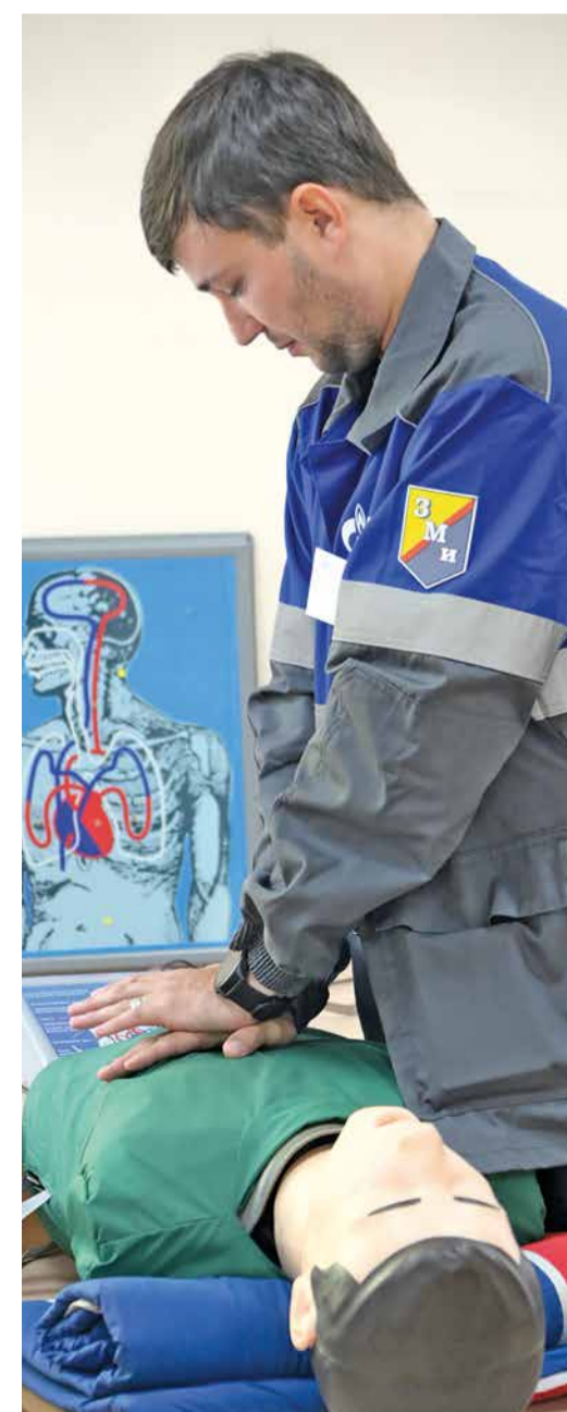
Отработка навыков на манекене — важная составляющая конкурса