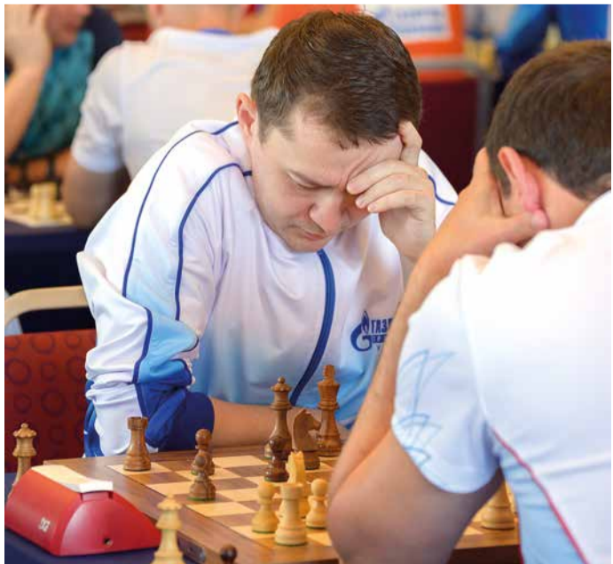
Сосредоточенность на максимум