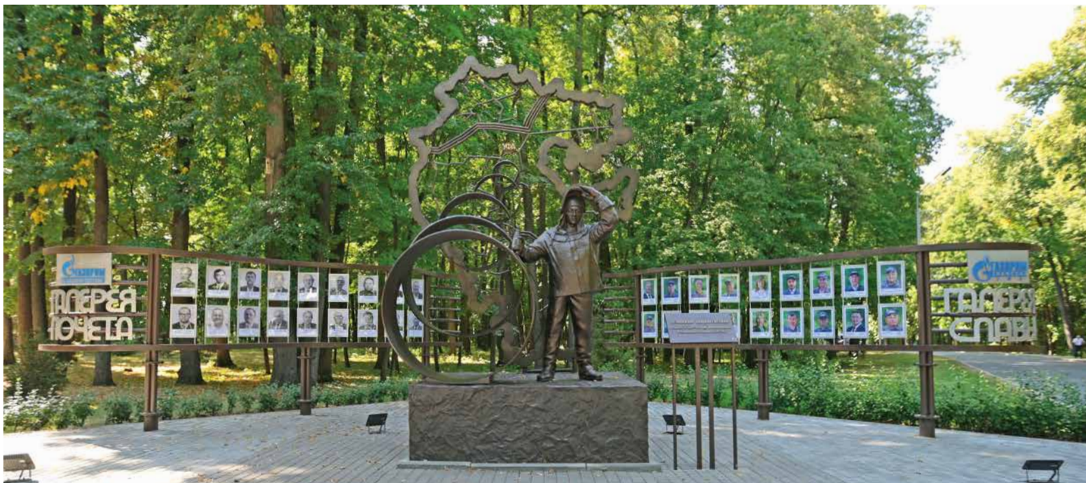
Галерея Почета и Славы