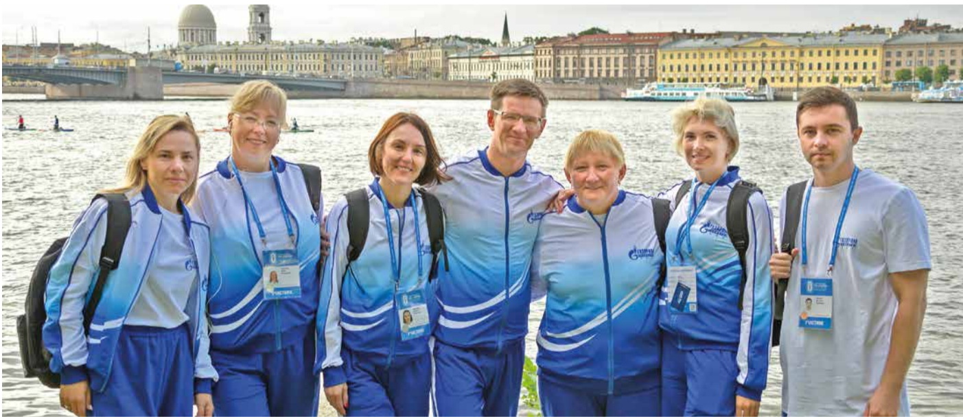
Команда пловцов на Петровском острове

– Мы приехали с хорошей подготовкой, показывать зрелую игру, с соответствующим настроем. Соперницы были все достойными, наши девушки выложились на 100%. Будем работать дальше.