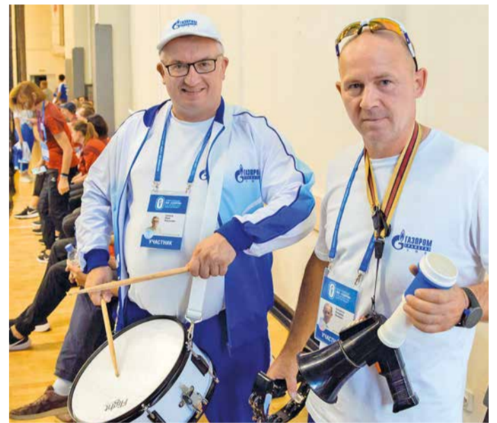
Болельщики задавали тон играм