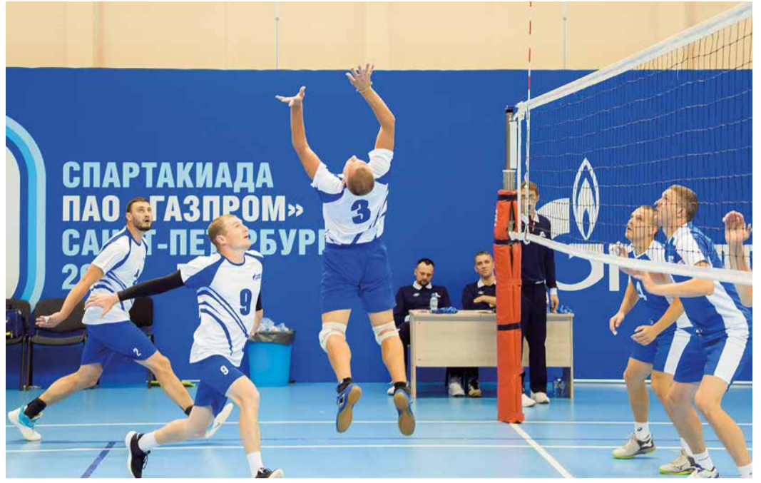
Волейболисток принимала «Сибур-Арена»

Спортивная база баскетбольного клуба «Зенит» приняла волейболисток. Девушки показали спортивный характер, отличную сыгранность и умение работать на результат: в семи играх они одержали 5 побед и заняли 9 место турнирной таблицы. Волейболисты Общества, обыграв уральских коллег в заключительной игре на площадке академии им. В.А. Платонова, расположились на 21 строчке.