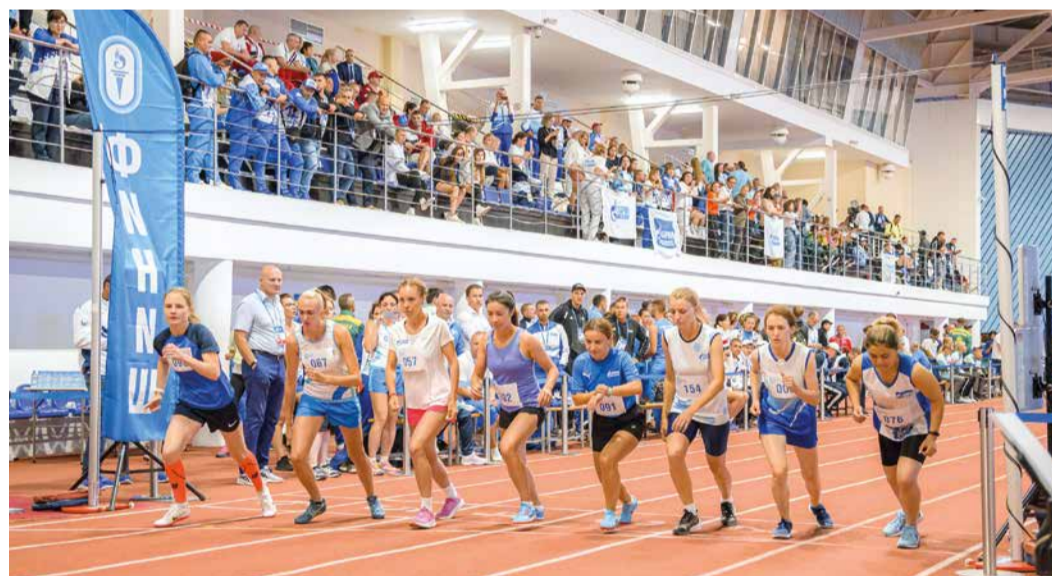
Готовность № 1