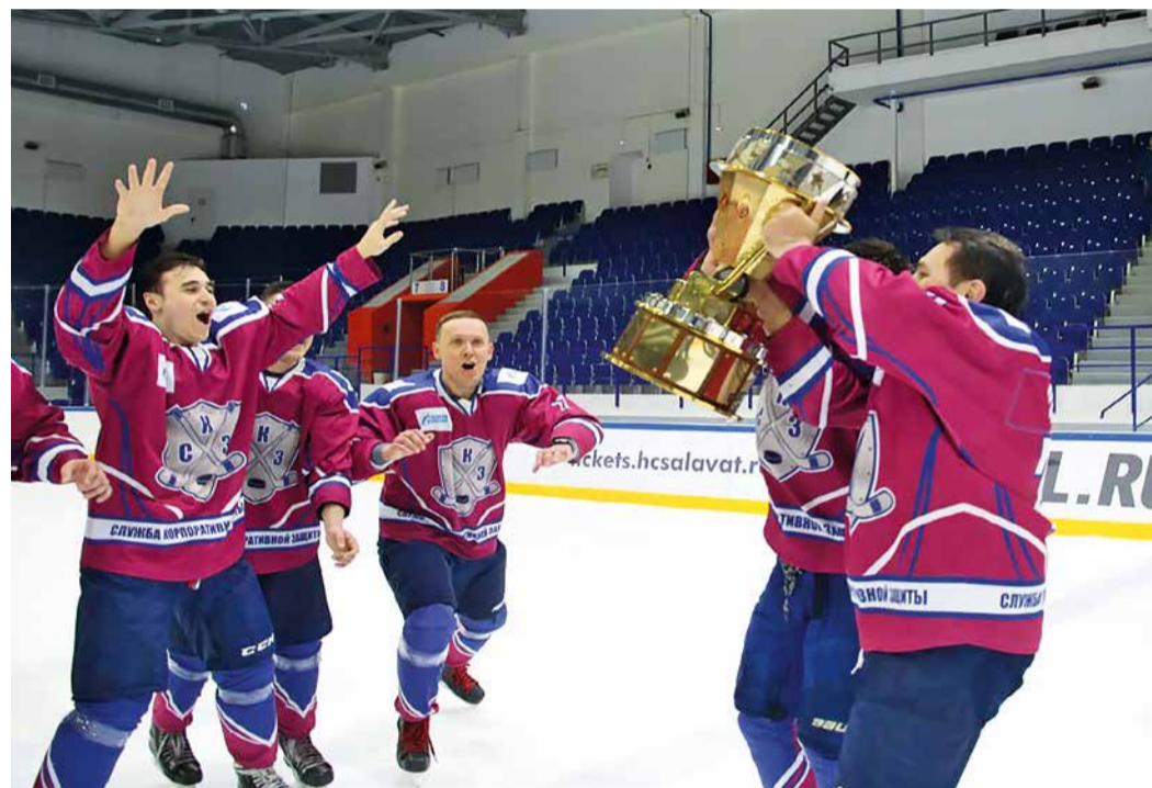
Победа за СКЗ!