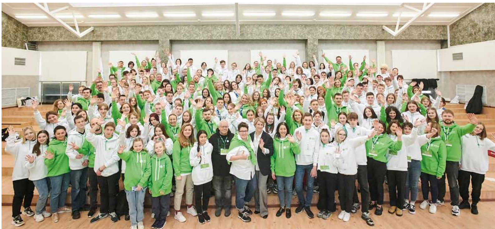
Участники и организаторы Первого экологического лагеря ПАО «Газпром»

Мы готовы работать, Создавать и менять, Готовы природу свою защищать! Узнают все про наши дела, Мы – «Газпром трансгаз Уфа»!