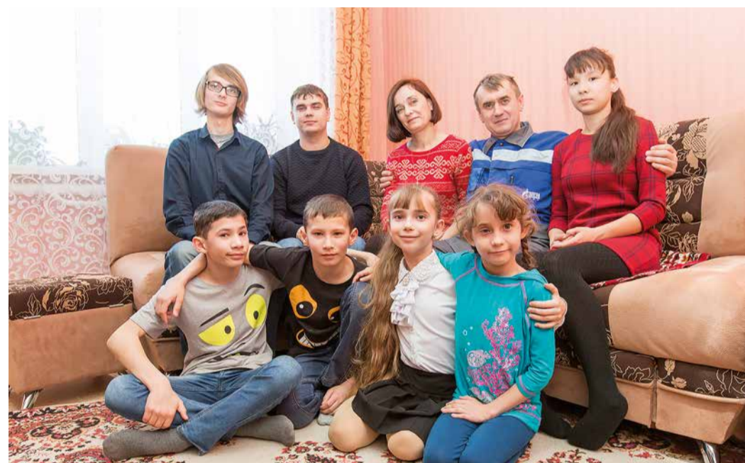
Люди – главная ценность

В 2022 году в Обществе разработаны План мероприятий по совершенствованию Единой системы управления производственной безопасностью и Программа мероприятий по внедрению культуры производственной безопасности. Документ включает мероприятия по направлению лидерства и мотивации работников в области производственной безопасности, обучения и повышения компетенций, управления рисками и безопасного выполнения работ, разработки и внедрения информационно-управляющих систем.