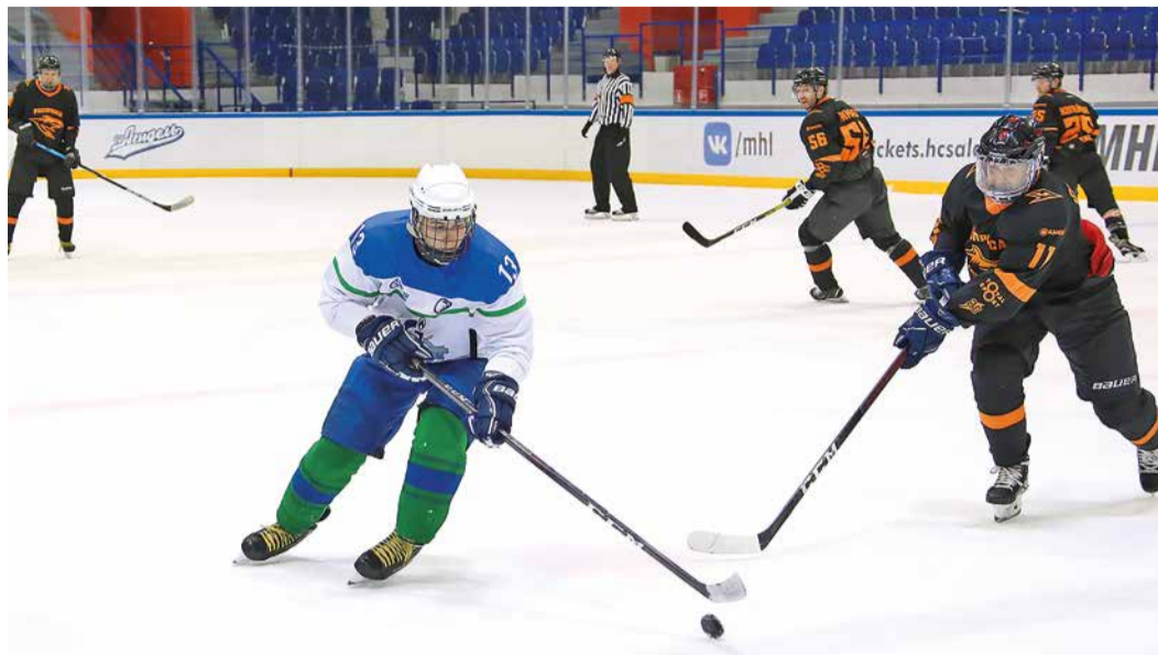
Очередная встреча на льду башкирских газотранспортников и федеральных журналистов

Во Дворце спорта прошли ежегодные товарищеские матчи по хоккею с командой «Российская пресса», а также финал Корпоративной хоккейной лиги.