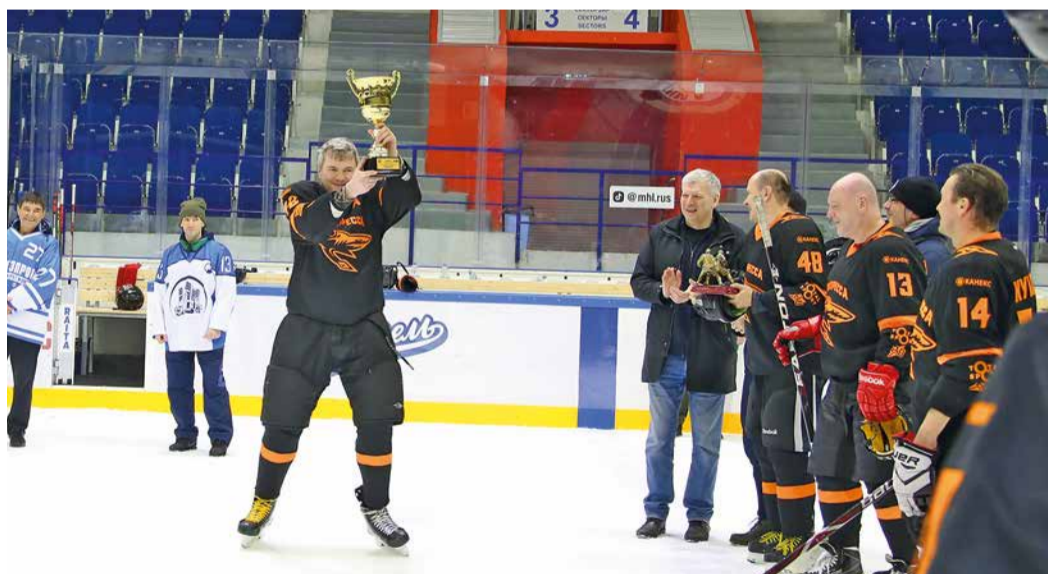
Кубок отправился в Москву

– Отличные команды, отличная организация турнира. Впрочем, как всегда, в Уфе все на уровне. Спасибо соперникам за прекрасную игру. Еще ни разу не было такого, чтобы команды играли плохо. Уровень хоккеистов с каждым годом растет. Думаю, в следующем году нам будет еще сложнее с ними играть, и будет еще более интересный хоккей!