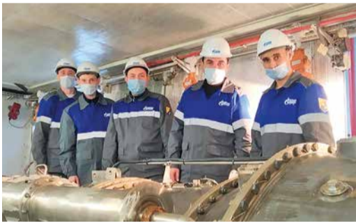
Специалисты из соседней республики изучают работу двигателя АЛ-31СТ

В Полянском ЛПУМГ с целью изучения опыта эксплуатации газоперекачивающих агрегатов с уфимским двигателем АЛ-31СТ побывали инженеры КИПиА и газокомпрессорной службы, а также машинисты технологических компрессоров ООО «Газпром трансгаз Казань».