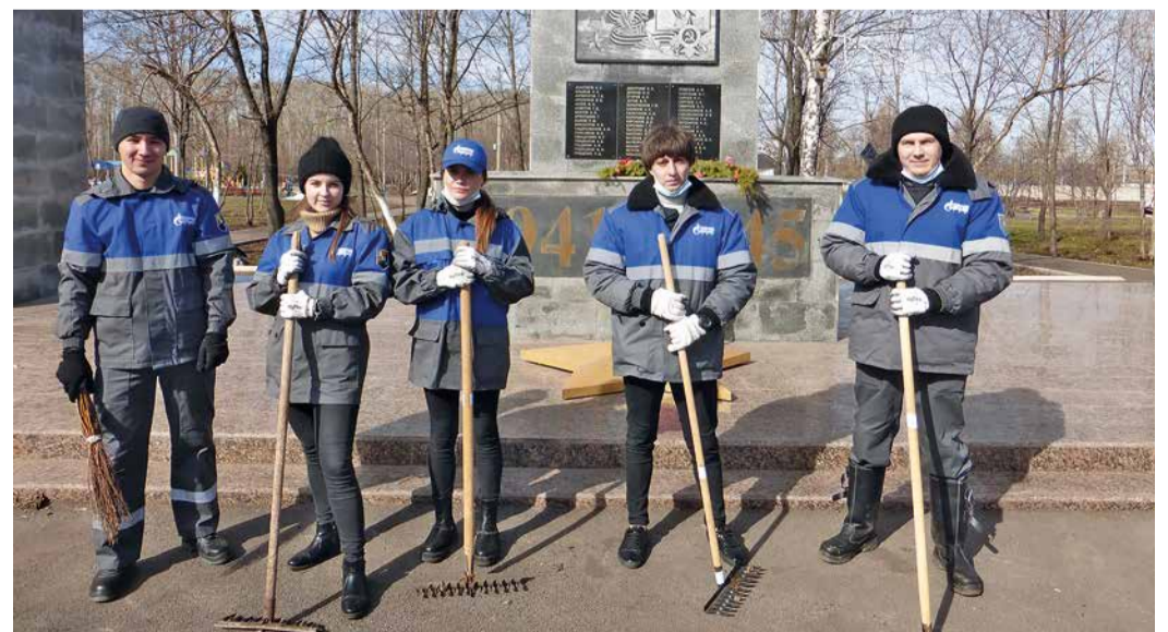
Приютовцы привели в порядок Парк славы поселка