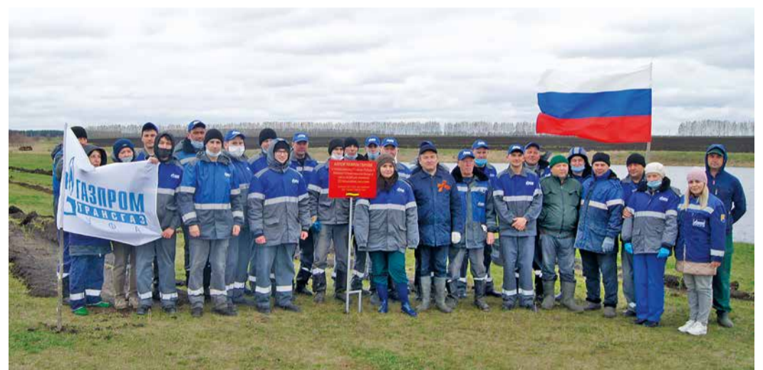
Дюртюлинцы высадили Аллею Памяти