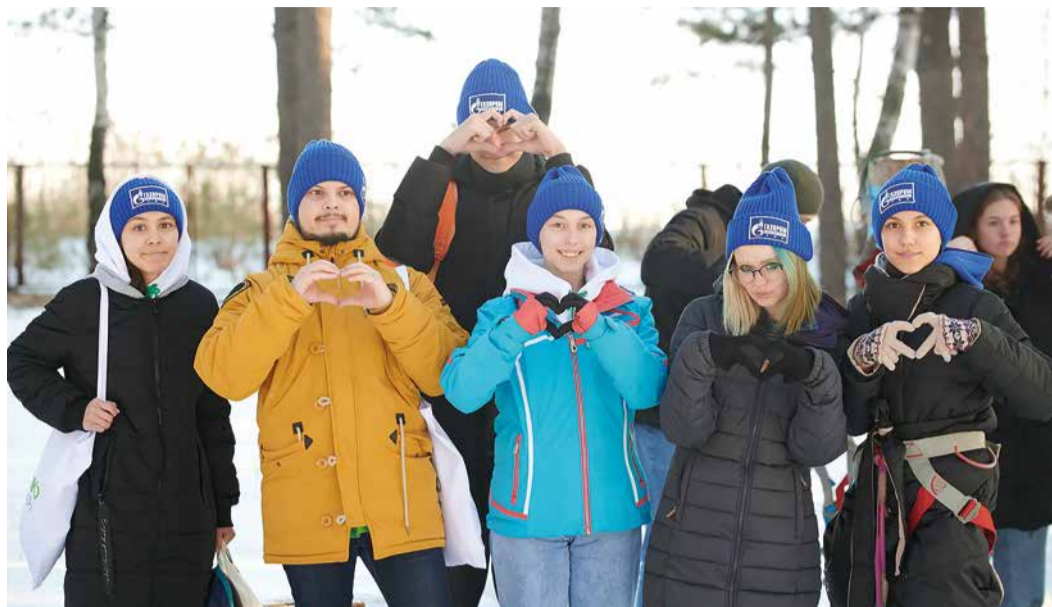
С любовью к природе