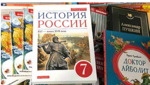
Предприятие закупило книги детям ДНР и ЛНР

ООО «Газпром трансгаз Уфа» и профсоюзная организация Общества присоединились к всероссийской акции «Книги – Донбассу». Детям освобожденных территорий Украины газотранспортники отправили сказки Пушкина, сборники стихов Агнии Барто и Корнея Чуковского, классическую литературу, учебники по русскому языку и истории для учащихся средних и старших классов, входящие в федеральный перечень.