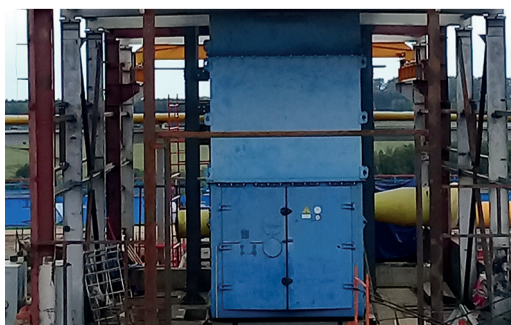
СДЕЛАНО В УФЕ стр. 2

Ричард СМИТ, генеральный секретарь Международных детских игр