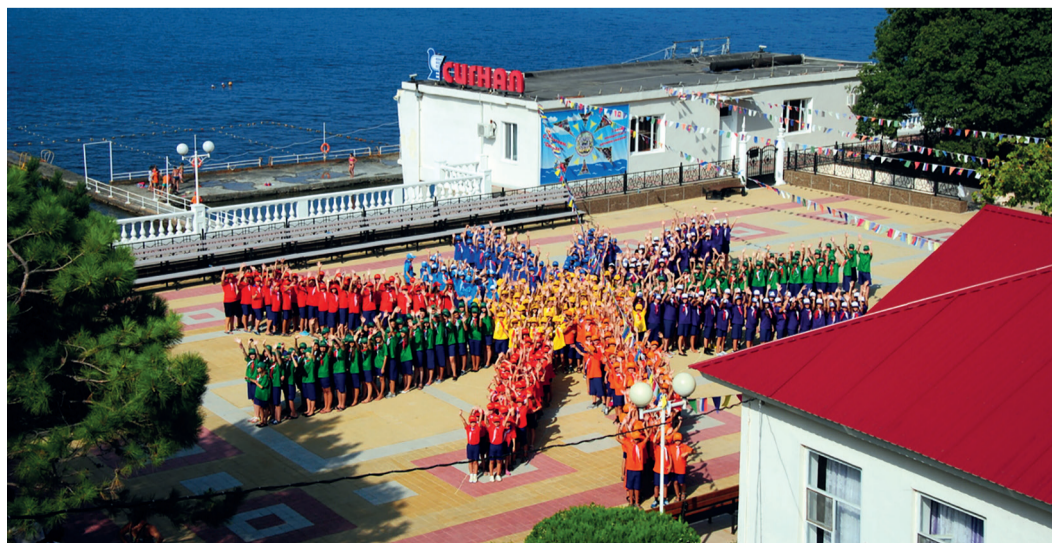
Детский комплекс «Сигнал» расположен на живописном берегу Черного моря