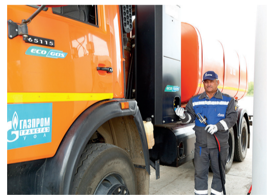
Больше половины автопарка предприятия работает на компримированном природном газе

Детальное обследование позволит выявить несоответствия технического состояния трубопроводов требованиям нормативной документации, которые могут снизить надежность и эффективность эксплуатации компрессорной станции.