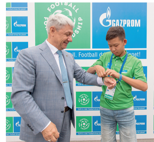
Сине-зеленый браслет – символ интернациональной дружбы