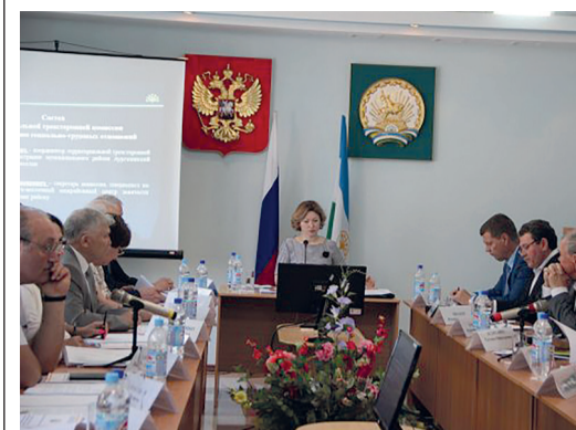
Выездное заседание комиссии состоялось в с. Толбазы