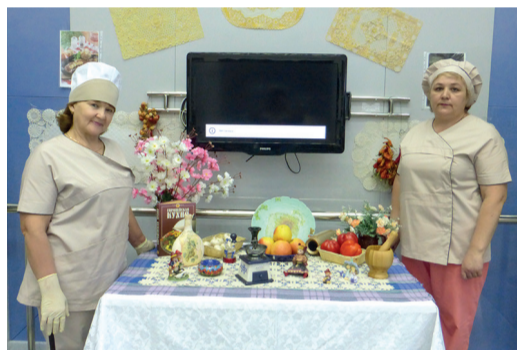
День национальной кухни – настоящий гастрономический праздник!

Лиана ЗИЯТДИНОВА.