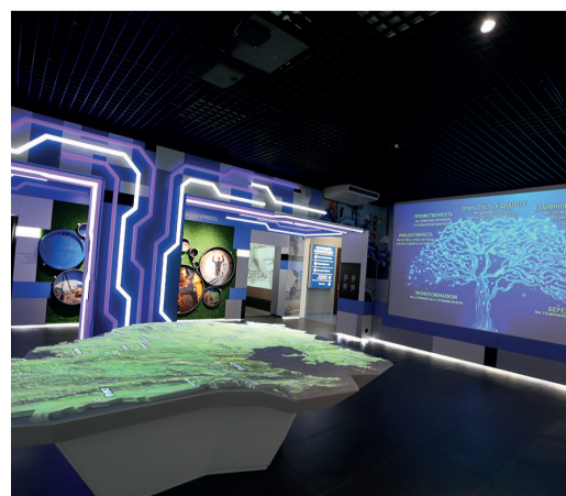
Зал истории и развития

Известно, что первый газ прошел по республике в 1953 году. Все этапы развития газовых магистралей региона отражены на специальной карте республики, также на ней обозначены «зоны» социальной ответственности «Газпром трансгаз Уфа». Примечательно, что на предприятии возрождена и поставлена на поток система выполнения норм Всероссийского физкультурно-спортивного комплекса «Готов к труду и обороне». Не случайно рядом