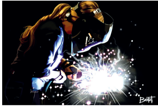
«Зажигая пламя...» Рисунок Альберта Харисова

Альберт пишет разножанровые композиции, рисует шаржи для друзей. Ему также доставляет удовольствие заниматься графическим дизайном. По мнению автора,