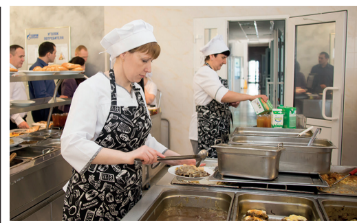
ГОРЯЧАЯ ЛИНИЯ стр. 7