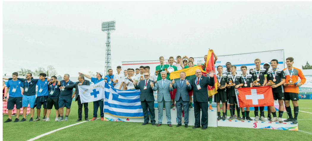
У спорта нет границ!

С 9 по 14 июля Уфа пребывала в статусе столицы 53-х летних Международных детских игр. Позади – годы подготовки и тренировок, а теперь уже вошли в историю и сами соревнования по девяти олимпийским видам спорта: легкой атлетике, плаванию, фехтованию, греко-римской борьбе, дзюдо, мини-футболу, баскетболу 3х3, пляжному волейболу и скалолазанию. В них приняли участие порядка 1 200 спортсменов из 84 городов 29 стран мира. Генеральным спонсором Международных детских игр выступила компания «Газпром».