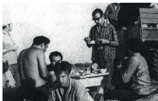
СТРОИЛ ЭПОХУ стр. 6