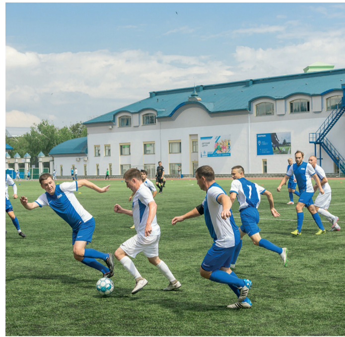
Борьба салаватских нефтехимиков и нижегородских газовиков