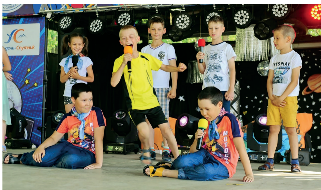
Лето – это маленькая жизнь!

– Каждый год в лучшем лагере «Сигнал» меня ждет что-то новое. Мы постоянно чем-то заняты, никогда не бывает скучно! Больше всего мне нравится купаться в море, играть в футбол и волейбол. У нас очень добрые вожаки, которые могут помочь тебе в любую минуту. Но самое главное, я приобрел много новых друзей. Сейчас мы активно поддерживаем общение друг с другом