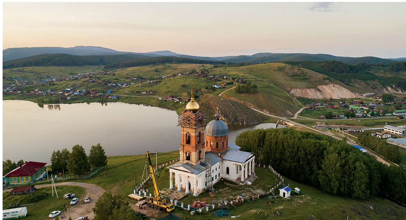
Установка купола – долгожданное и знаковое событие для жителей села

Эльвира КАШФИЕВА.