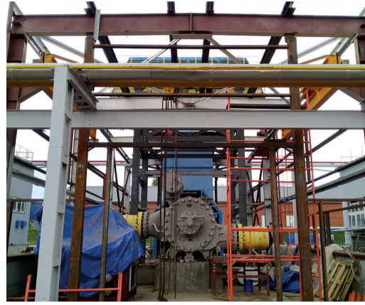
Реконструкция в разгаре

В Обществе реализуются инвестиционные проекты по реконструкции компрессорных станций КС-17 Полянского ЛПУМГ и КС-19 Шаранского ЛПУМГ.