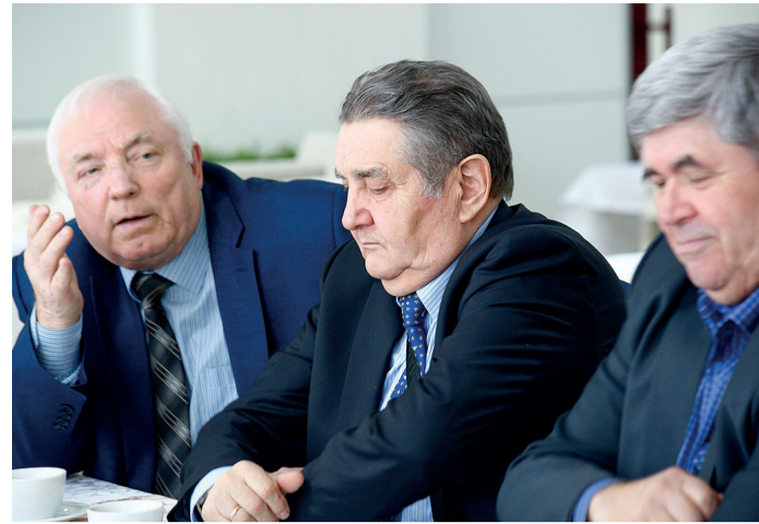
Ветераны предприятия поделились ценными воспоминаниями и фотографиями

В подготовке издания активное участие принимали