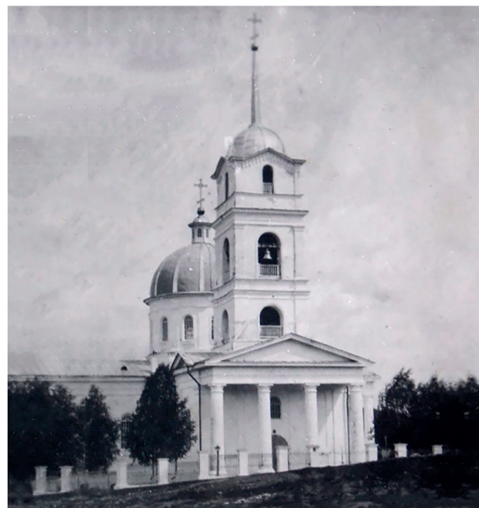
Храм Казанской иконы Божией матери, XX век

В 1929 году власти попытались закрыть святыню, однако верхнеавзянцы ее отстояли. Но уже 14 февраля 1930 года храм был закрыт и лишь в 1991 году возвращен верующим. Восстанавливали церковь всем миром. Значительную поддержку оказали работники Сибайского филиала.