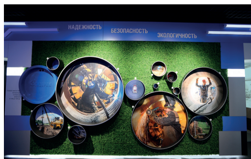
НЕДРА ОНЛАЙН стр. 3