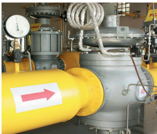
Выполняются работы по замене оборудования на современные комбинированные марки

В рамках подготовки газового хозяйства г. Уфы к эксплуатации в осенне-зимний период 2019–2020 гг. филиалом ПАО «Газпром газораспределение Уфа» разработан план мероприятий по обеспечению потребителей города Уфы бесперебойной поставкой природного газа. Документом предусмотрены строительно-монтажные работы по строительству головного газорегуляторного пункта «Нижегородка», перекладка газопровода от поворота на уфимскую ТЭЦ-3 до головного газорегуляторного пункта «Тимашево», а также строительство газопровода D500 Новоалександровка–Затон. Предприятием ежегодно в рамках подготовки газового хозяйства к осенне-зимнему периоду проводятся планово-предупредительные работы и техническое обслуживание 4 799,43 километра наружных сетей.