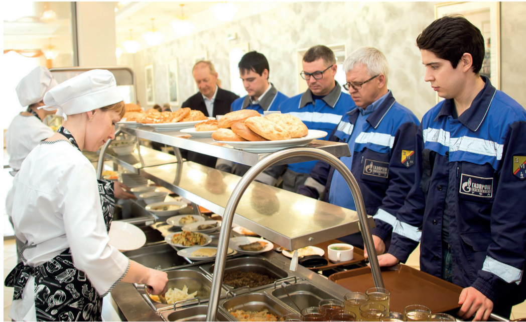
Обеды в столовых Общества отличаются приемлемой ценой

Процесс приготовления пищи происходит в специально оборудованных помещениях. У каждого сотрудника – своя зона ответственности. Одни готовят мясо, другие – овощи, третьи – выпечку. Работа здесь кипит в прямом смысле этого слова. А когда все готово, насту-