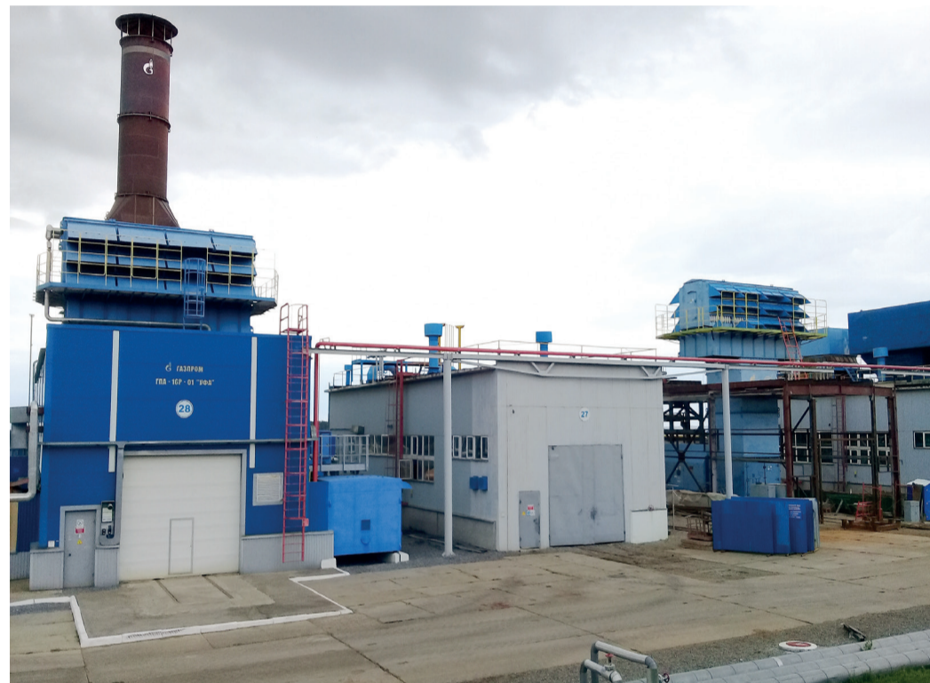
КС-19: эпоха перемен

Диана САРВАРДИНОВА.