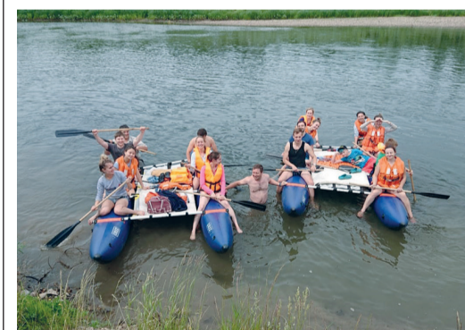
Сплав дружбы и веселья!

Молодые специалисты Управления материально-технического снабжения и комплектации побывали на сплаве по реке Инзер. Ранним утром, пройдя инструктаж, они отправились на катамаранах к достопримечательностям Архангельского и Белорецкого районов. Туристический сплав начался с места впадения р. Аскино в р. Инзер с остановкой на Абзановском водопаде. Он расположен в ста метрах от берега и в летнее время создает иллюзию зеленого зеркала на скале, поскольку вода на обрыве сочится по мху. Насладившись красивыми видами, группа отправилась дальше. Маршрут завершился в с. Ассы. В рамках мероприятия состоялась экологическая акция по очистке берега реки Инзер от мусора.