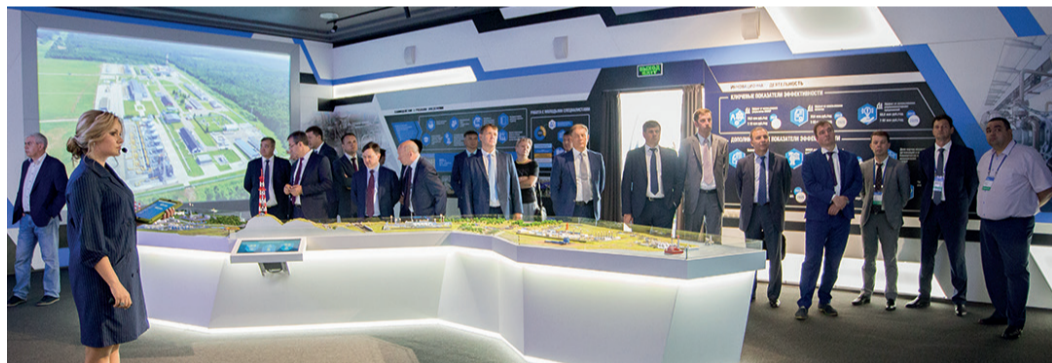
Информационно-выставочный центр – сочетание традиций и инноваций

Соединить вместе уникальные артефакты и мультимедийные технологии непросто. Для того, чтобы история и современность органично дополняли друг друга, требуются не только технические навыки, но и душа – тогда легче прочувствовать прошлое, понять настоящее и даже заглянуть в будущее. Информационно-выставочный центр, открывшийся на предприятии, стал одновременно и музеем, и справочником сегодняшнего дня, а для кого-то, возможно, и учебником по самым передовым информационным технологиям.