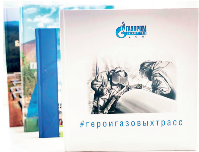
#герои газовой трассы – книга, рассчитанная на самый широкий круг читателей

Вышла в свет новая книга о становлении и развитии ООО «Газпром трансгаз Уфа». Она написана на языке тех, кто будет вершить судьбу газотранспортной отрасли в будущем, – языке твитов, постов и лайков, и рассчитана на самый широкий круг читателей.