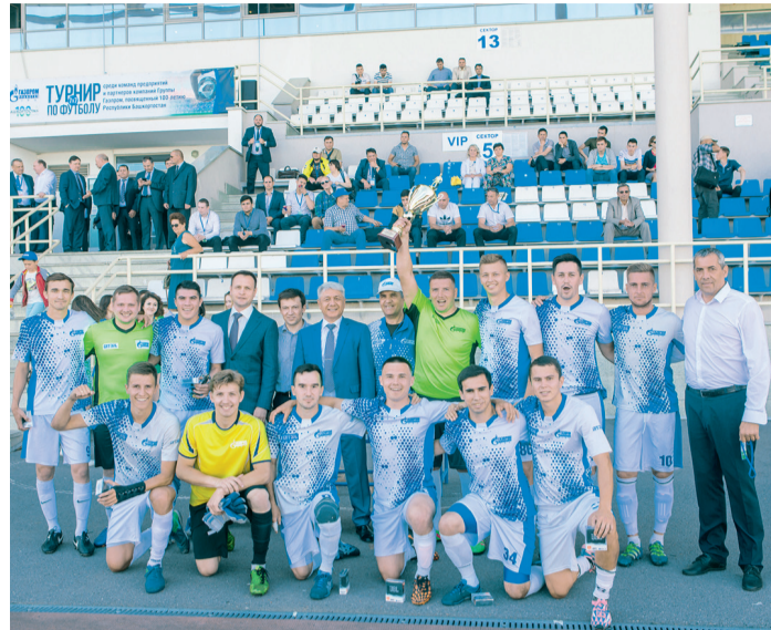
Уфимские «витязи» – триумфаторы турнира

В Уфе состоялся футбольный турнир в формате 7х7 с участием 6 команд предприятий Группы Газпром, посвященный 100-летию Республики Башкортостан. В борьбе за кубок и медали на стадионе «Динамо» сошлись сборные Чайковского, Оренбурга, Нижнего Новгорода, Саратова, Салавата и хозяева поля – уфимские «витязи».