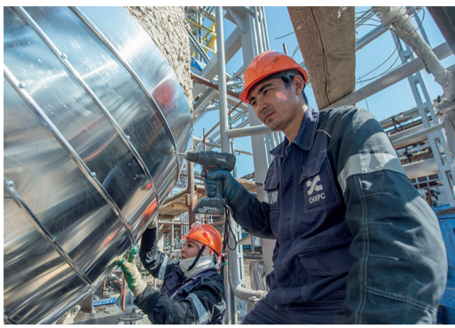
Монтаж теплоизоляции в цехе № 34

Четыре цеха завода «Мономер» ООО «Газпром нефтехим Салават» выведены в рабочий технологический режим. Подразделения в мае-июне останавливались на капитальный ремонт. В его рамках состоялись диагностика, ревизия и техническое освидетельствование технологического оборудования и трубопроводов. Реализованы мероприятия, направленные на увеличение производительности и эффективности.