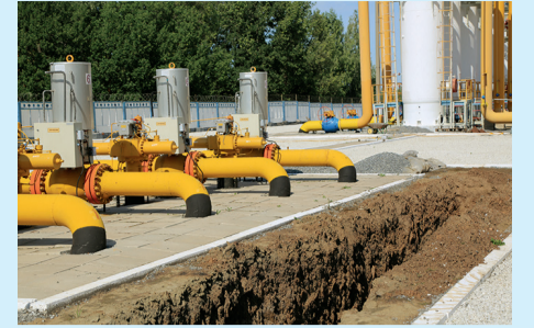
Экспертиза на КС-18 включает в себя два этапа