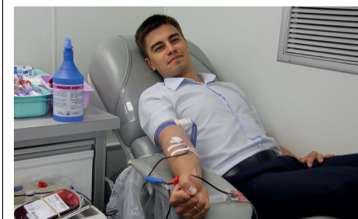
Работники Общества ежегодно оказывают поддержку донорскому движению

В Обществе состоялась акция «День донора», организованная по инициативе Центрального совета молодых ученых и специалистов предприятия. Передвижные комплексы ГБУЗ «Республиканская станция переливания крови» расположились на площадках КАЗС и Инженерно-технического центра. Ежегодно работники предприятия сдают около 30 литров крови, которая после соответствующей обработки направляется на заморозку и хранение в Республиканский банк крови.