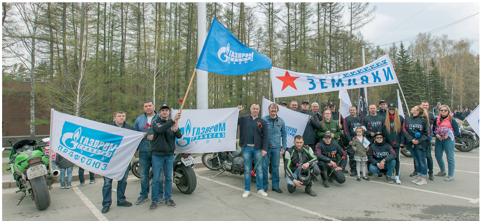
Уфа – первая промежуточная остановка участников мотопробега