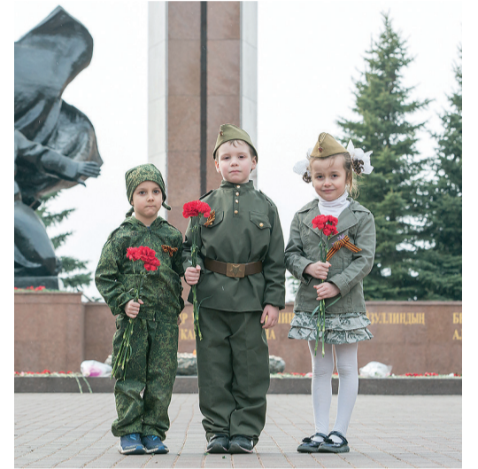
Юные участники акции возложили цветы к памятнику Героев Советского Союза

Примечательно, что путь Краснознаменной Печенгской дивизии повторяли несколько раз.