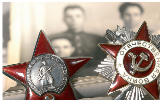
ГЕРОИ ВЕЧНОГО ВРЕМЕНИ стр. 4-5