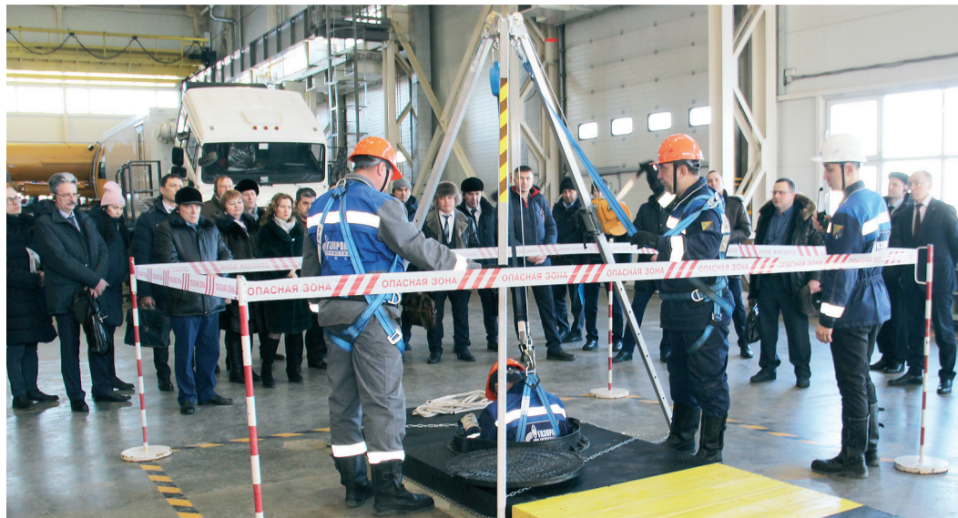
Работа в колодцах с применением штатива «Трипод»

Гаджеты и технологии, без чего сегодня немыслима наша жизнь, успешно внедряются в области охраны труда на предприятии. Интерактивный терминал, видеозкраны, блокирующие устройства – эти и другие новинки приходят на помощь специалистам данной сферы. В преддверии Всемирного дня охраны труда мы отправились в Управление аварийно-восстановительных работ для того, чтобы оценить их в деле.