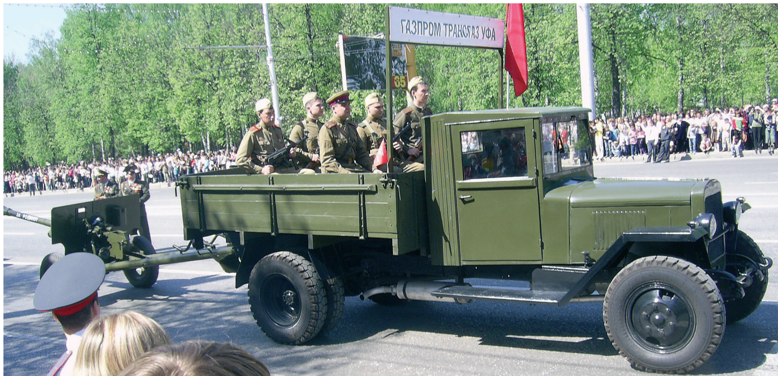
Каждый четвертый автомобиль был отреставрирован газотранспортниками