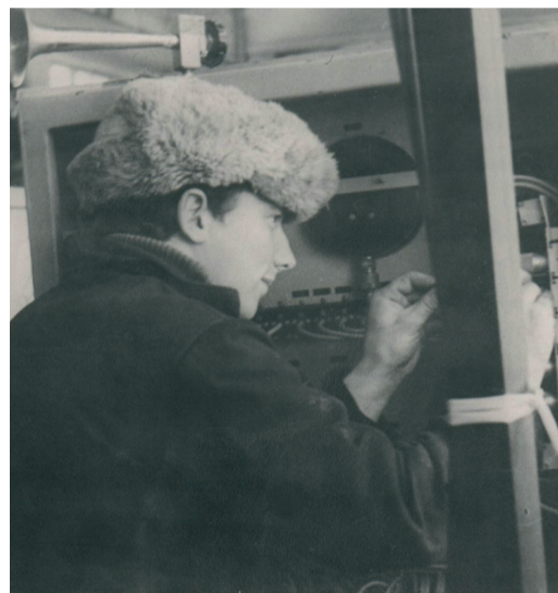
Начало трудовой деятельности: приборист Стерлитамакского ЛПУМГ

Результаты этой командной работы всегда давали свои щедрые плоды. С 2003 года на месте бывшей базы ПМК-17 в городе