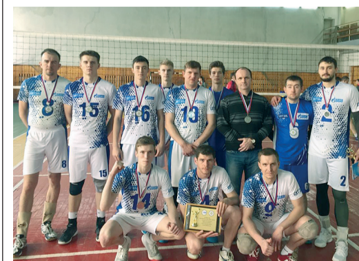
Волейболисты Общества достойно выступили в открытом Чемпионате ПФО

Успешно завершили сезон мужские и женские волейбольные сборные предприятия. По итогам Чемпионата России 1 Лиги – открытого Чемпионата ПФО уфимские «витязи» завоевали серебряные медали. В финале турнира, который состоялся в г. Кирове, они обыграли сборные Оренбурга (3:0) и Набережных