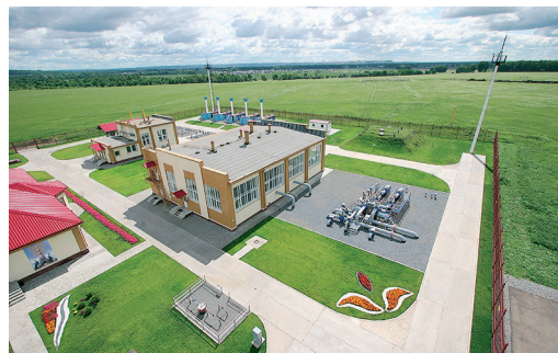
ГАЗ ДЛЯ МЕГАПОЛИСА стр. 7