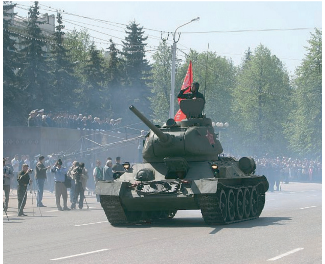
Танк Победы, легендарная 34-ка