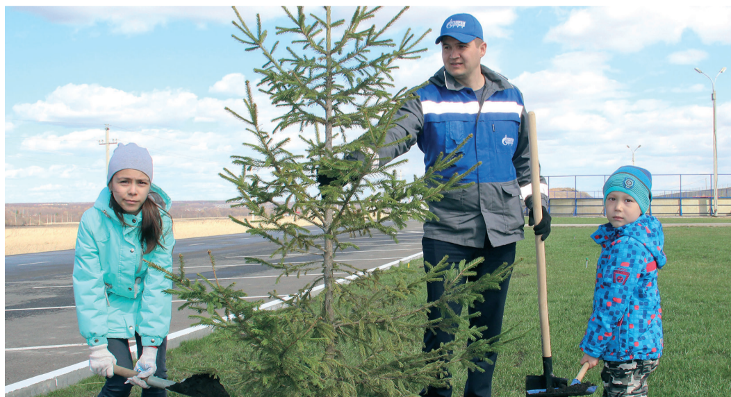
В акции участвовали семьи газотранспортников

Работники «Газпром трансгаз Уфа», члены их семей и ветераны предприятия присоединились к единой республиканской акции «Зеленая Башкирия».