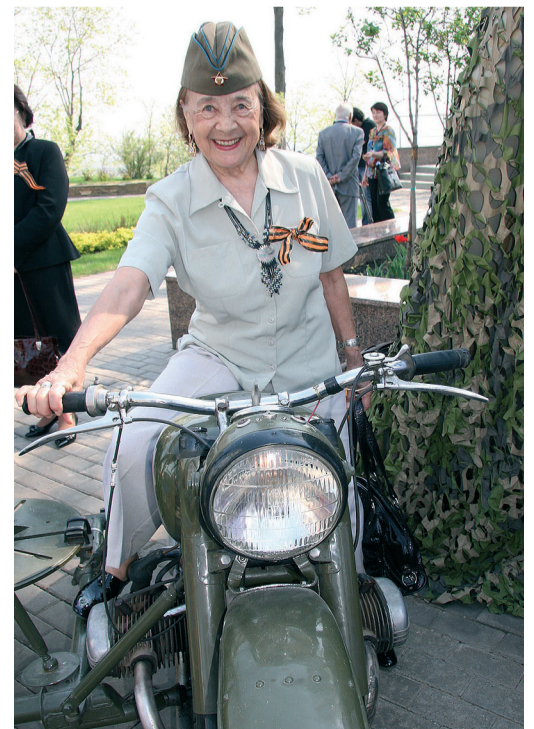
Техника вызвала большой интерес у ветеранов предприятия