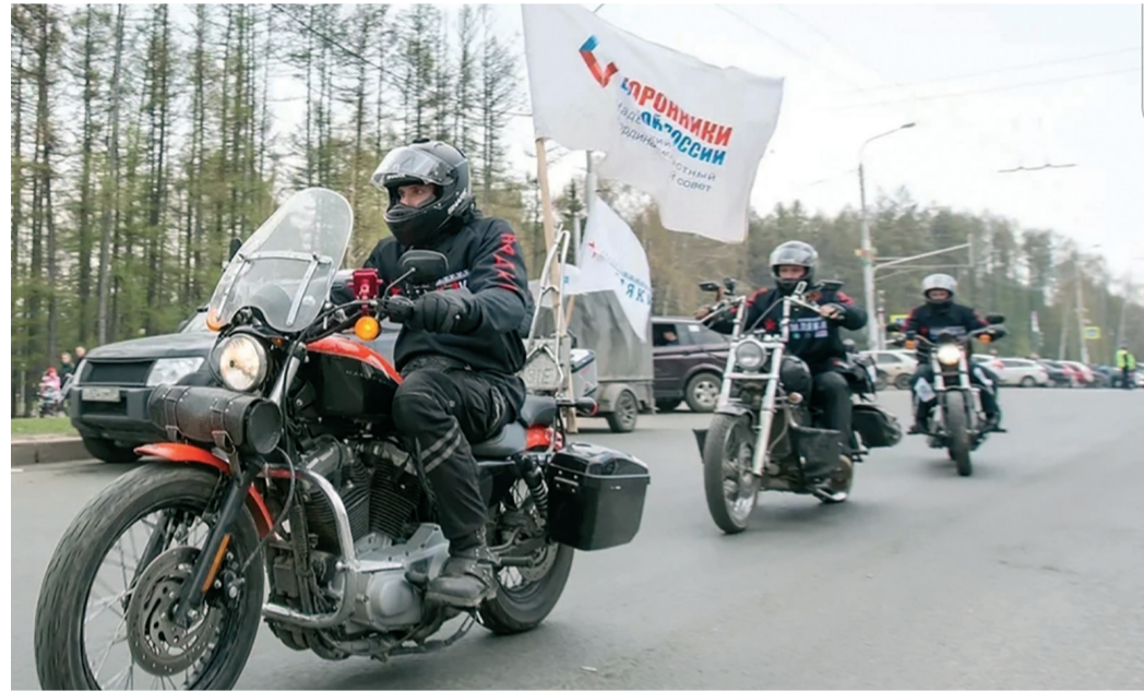
Следующий пункт – г. Казань