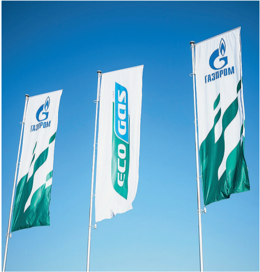
В Башкортостане расширяется сеть АГНКС

В Башкортостане появятся еще три новые АГНКС. В настоящее время подобраны земельные участки для строительства станций в Уфе, Нефтекамске и с. Кармаскалы. Газозаправочная сеть «Газпрома» в регионе состоит из 14 автомобильных газонаполнительных компрессорных станций (в том числе четырех – в Уфе) и двух модулей для заправки компримированным природным газом. Большая работа ведется по переводу техники на метан и популяризации газомоторного топлива.