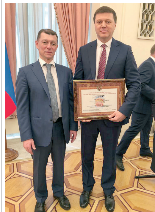
ООО «Газпром трансгаз Уфа» вновь в числе лучших российских предприятий

ООО «Газпром трансгаз Уфа» удостоено второго места в федеральном конкурсе «Российская организация высокой социальной эффективности» за 2018 год в номинации «За формирование здорового образа жизни в организациях производственной сферы».