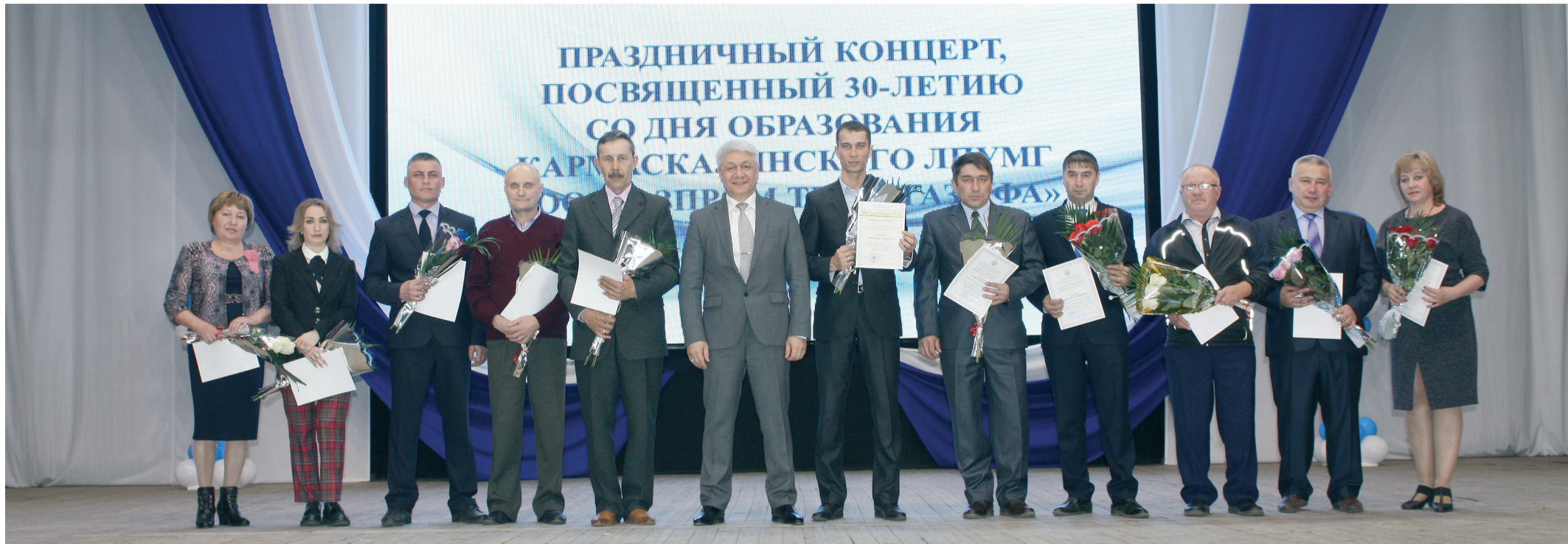
Генеральный директор ООО «Газпром трансгаз Уфа» вручил лучшим работникам отраслевые награды

Главный газовый донор башкирской столицы отметил юбилей. Три десятка лет назад было организовано Кармаскалинское ЛПУМГ. Сегодня филиал бесперебойно снабжает газом центральную часть Башкортостана – это семь районов республики и вся Уфа.