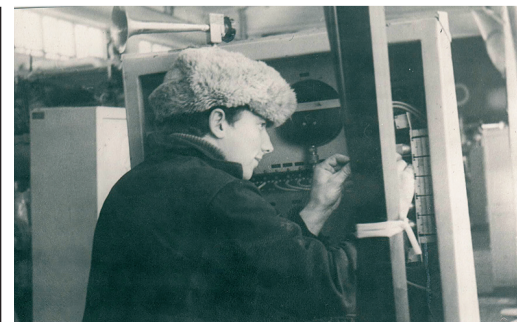
ПОЛВЕКА – ГАЗОВОЙ ОТРАСЛИ стр. 8