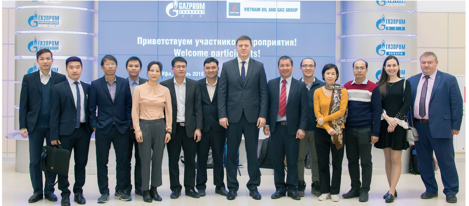
Вьетнамские коллеги ознакомились с деятельностью «Газпром трансгаз Уфа»

В Республике Башкортостан побывала делегация специалистов Корпорации нефти и газа (КНГ) «Петровьетнам». Стажировка в ООО «Газпром трансгаз Уфа» состоялась в рамках программы обучения сотрудников компаний Группы Газпром, реализуемой совместно с зарубежными предприятиями.