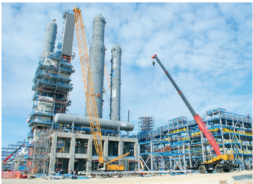
Площадка строительства Амурского газоперерабатывающего завода, март 2019 года

Амурская область является регионом стратегических интересов «Газпрома». Через ее территорию проходит маршрут газопровода «Сила Сибири», по которому 1 декабря 2019 года начнутся первые поставки российского трубопроводного газа в Китай. Продолжается сооружение приграничной компрессорной станции «Атаманская». Идет сооружение Амур-