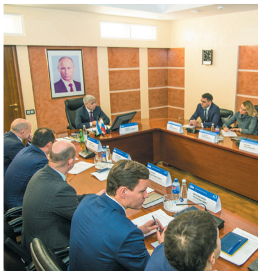
На повестке дня вопрос эксплуатации труб на магистральных газопроводах ООО «Газпром трансгаз Уфа»