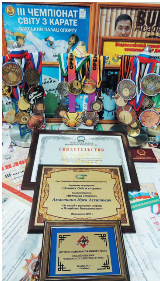
Копилка наград Ирека Ахметшина