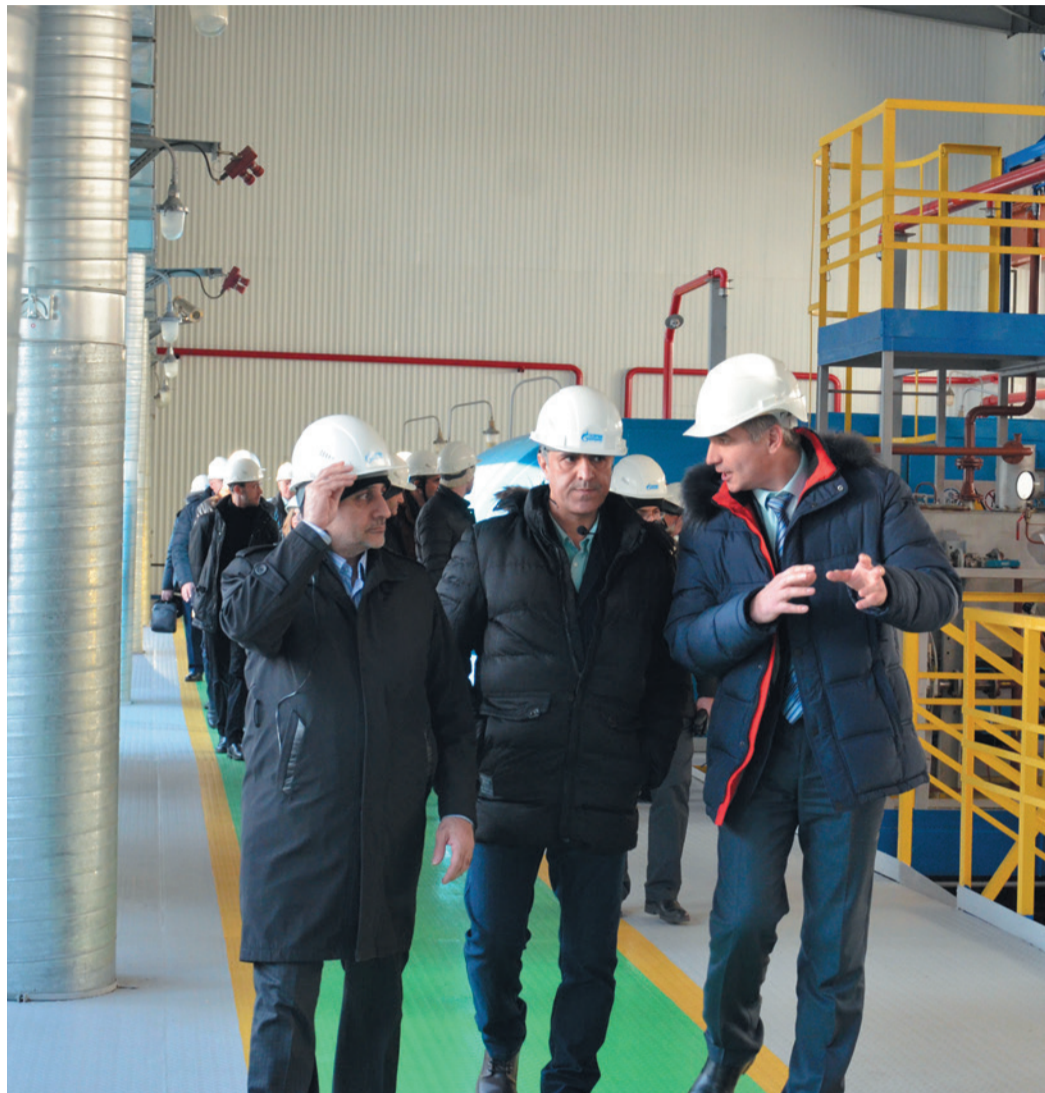
Иранцы высоко оценили работу компрессорной станции КС-4 «Поляна»

Официальная делегация Oil Turbo Compressor (Исламская Республика Иран) посетила Полянское ЛПУМГ ООО «Газпром трансгаз Уфа». Визит был инициирован ПАО «ОДК-УМПО» для демонстрации работы газоперекачивающих агрегатов с авиационным приводом АЛ-31СТ.