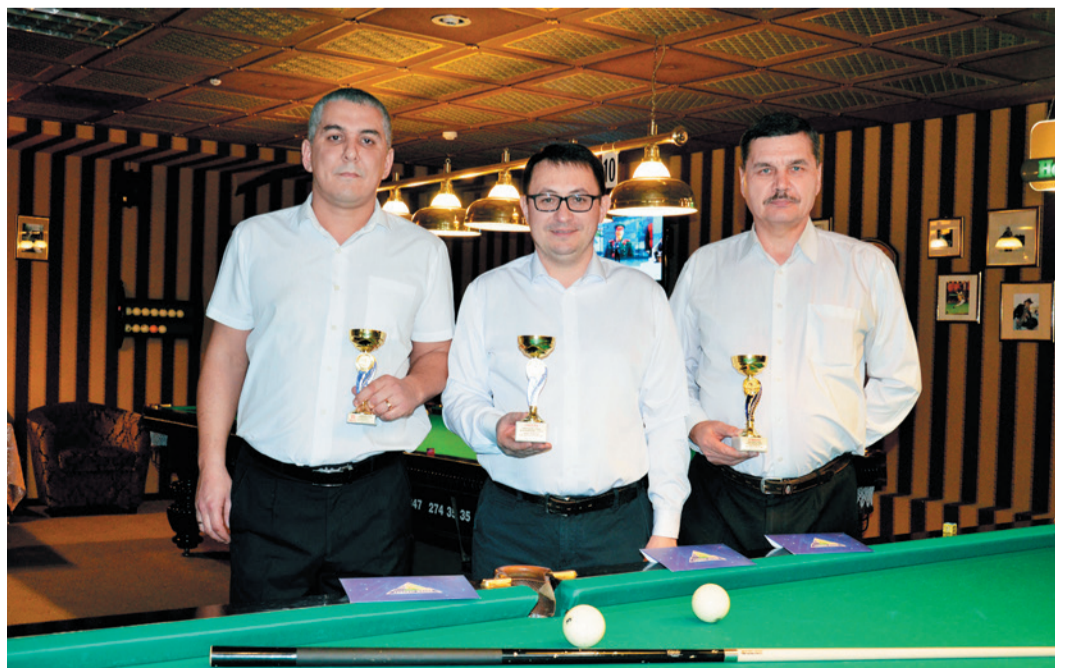
В числе лучших