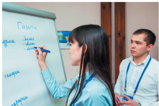
Участники семинара предложили свои проекты идеальной газеты Общества