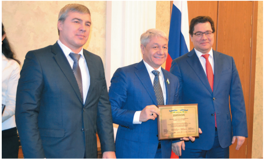
ООО «Газпром трансгаз Уфа» удостоено сразу четырех наград