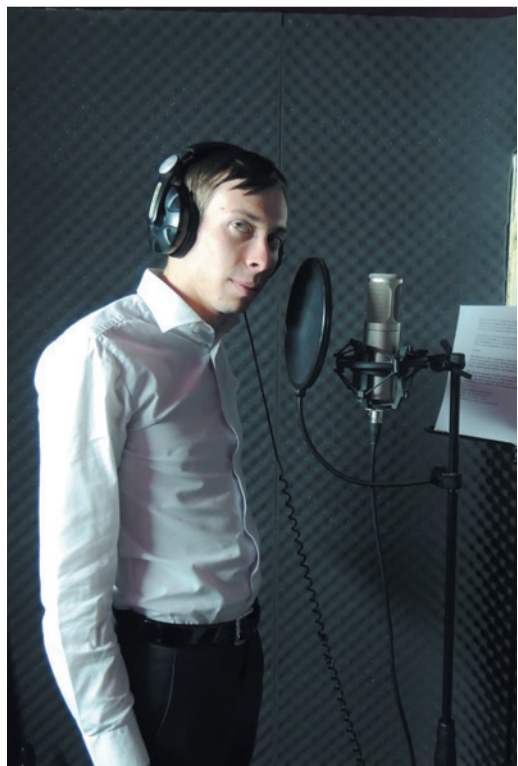
В студии во время записи песни