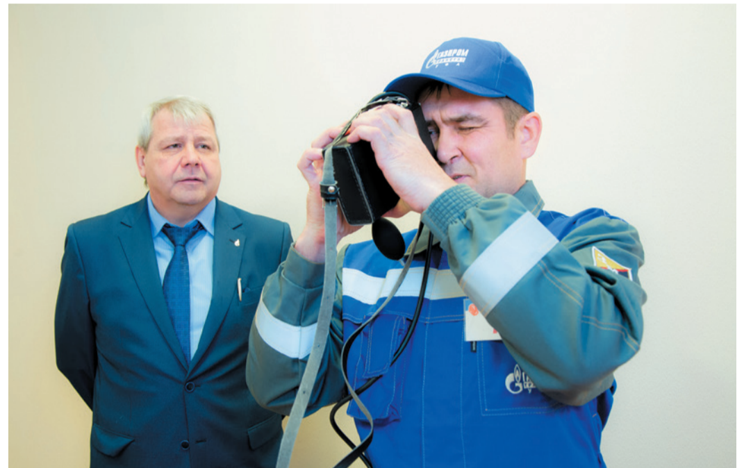
Практический этап конкурса среди уполномоченных по охране труда