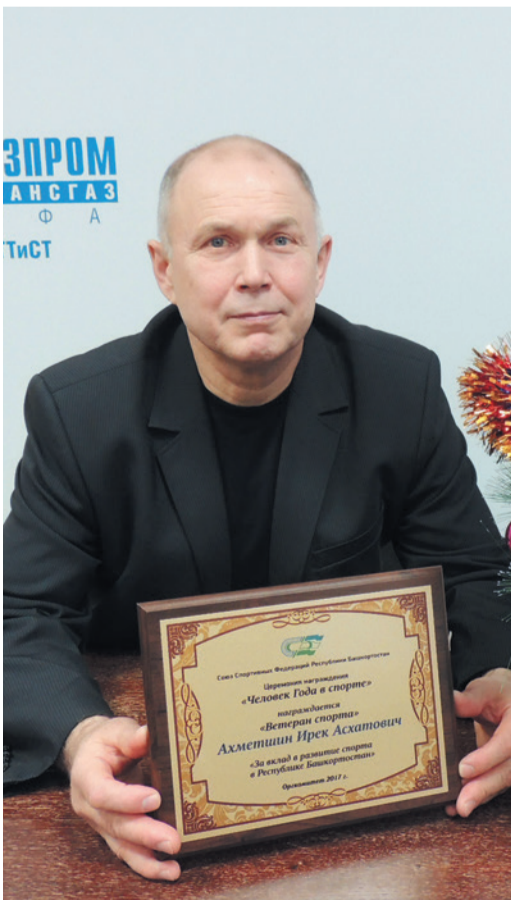
Почетная премия – за любовь к спорту