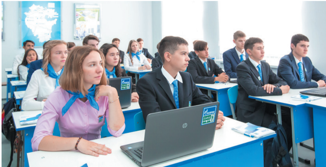
Первый уфимский «Газпром-класс». Растим будущее газовой отрасли со школьной скамьи

«Газпром трансгаз Уфа» является одним из важных социальных партнеров республики, создающих условия для трудоустройства молодежи. Налажено и продолжает успешно развиваться сотрудничество с целым рядом ведущих университетов региона, особенное место среди которых занимают Уфимский государственный нефтяной и авиационный технические университеты (УГНТУ и УГАТУ). Подведем промежуточные итоги работы Общества в деле научного и образовательного взаимодействия с учреждениями высшего профессионального образования.