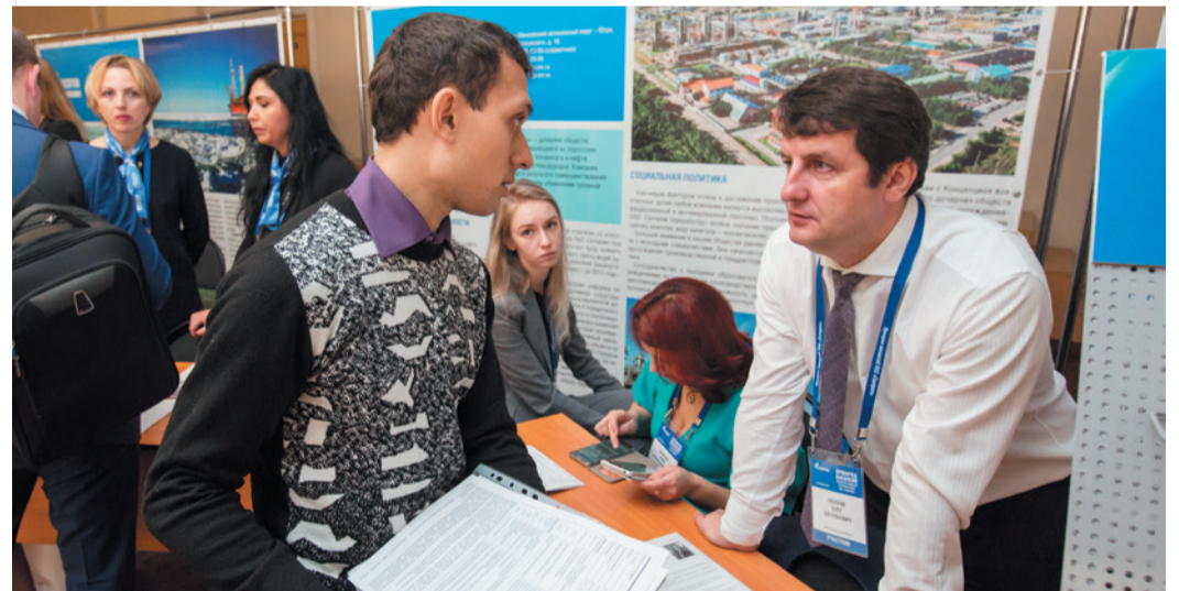
Ярмарки вакансий ПАО «Газпром» в УГНТУ ежегодно собирают порядка тысячи студентов уфимских вузов

Необходимо отметить, в мае прошлого года в Уфимском нефтяном университете состоялось заседание научно-образовательного межвузовского совета ПАО «Газпром», выступаю-