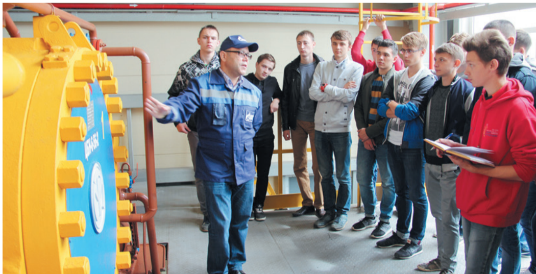
Ознакомительная экскурсия студентов вузов республики на объекты ООО «Газпром трансгаз Уфа»

Новая экономика требует новых компетенций – не только теоретических знаний, навыков программирования и работы с данными, но и креативного, аналитического мышления, коммуникативных навыков и умения работать в условиях неопределенности. Выпускникам необходимо обладать навыками командной и проектной работы, публичных выступлений и презентаций, которые при-