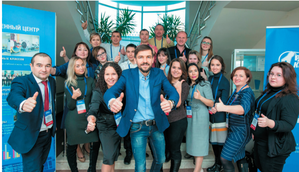
Быть рабкором – почетно!

На базе Учебно-производственного центра прошел образовательный семинар для рабочих корреспондентов нашего предприятия. В нем приняли участие 19 работников филиалов, чьи профессиональные обязанности далеки от журналистики, но которые с почетной регулярностью готовят информационные заметки о событиях, происходящих в их подразделениях, для новостной ленты сайта Общества.