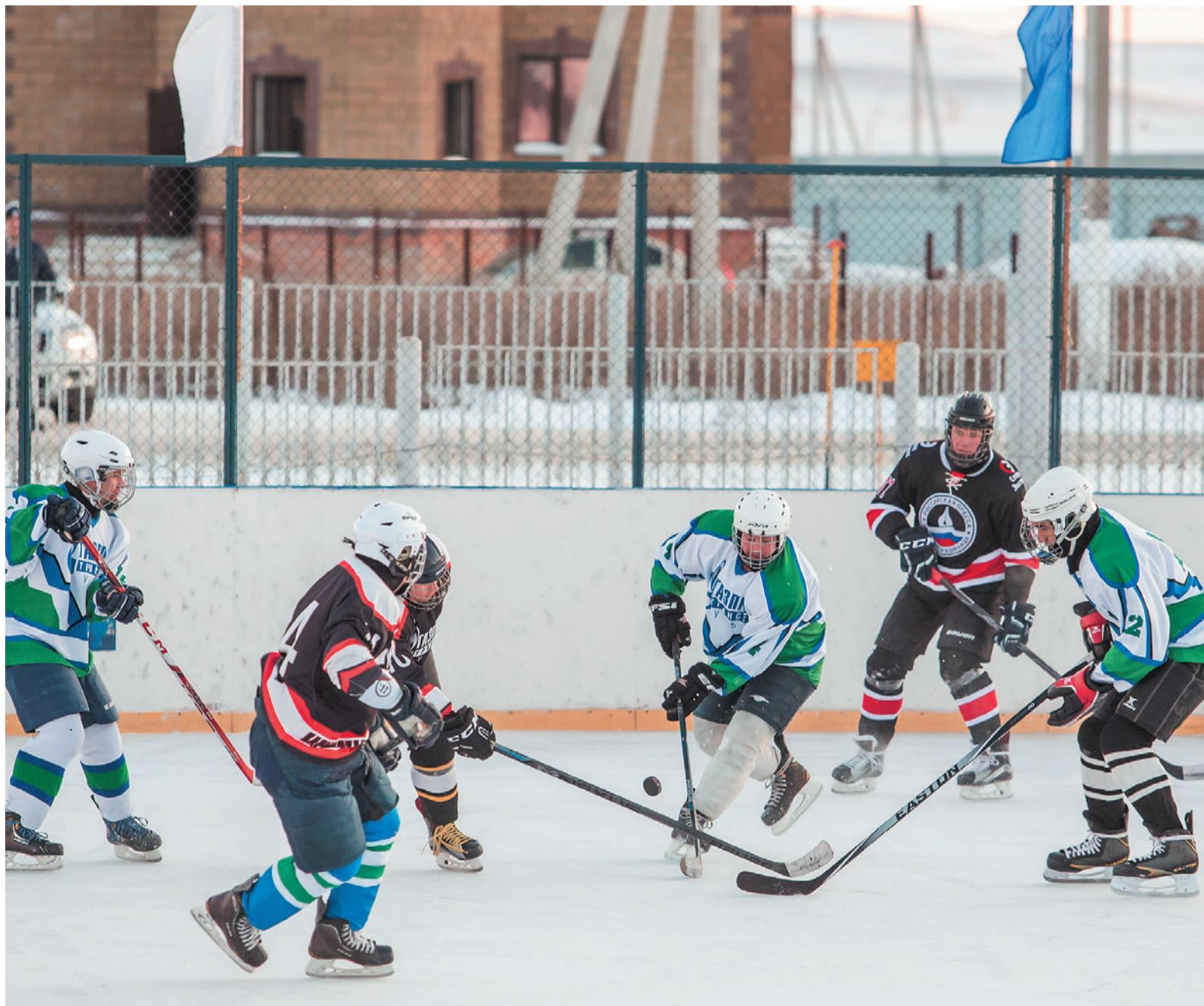
Момент матча между командами «Газпром трансгаз Уфа» и «Российская пресса»

Не мог не отличиться еще один звездный представитель гостей — многократный чемпи-