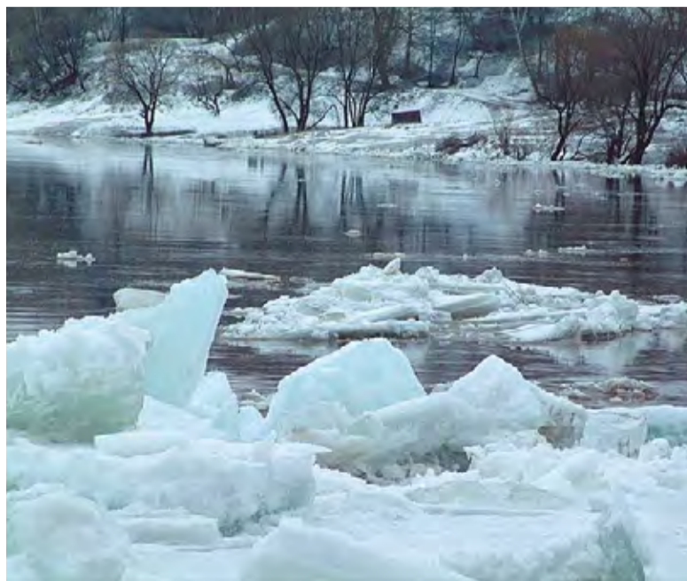
Нынешней весной в республике ожидается сильное половодье