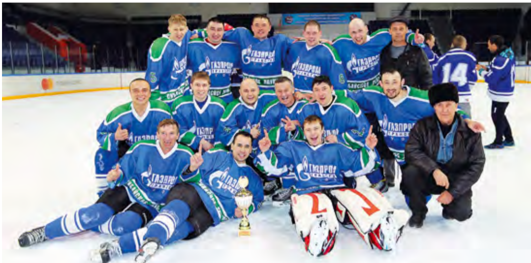
Команда Сибайского ЛПУМГ, занявшая первое место в турнире КХЛ

VIII турнир корпоративной хоккейной лиги подошел к концу. 18 марта в уфимском Дворце спорта состоялись финальные игры традиционных зимних состязаний «Газпром трансгаз Уфа». Нынешний сезон игроки и болельщики будут помнить еще долго: за два месяца команды выходили на лед около пятидесяти раз.