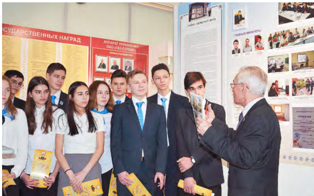
Во время экскурсии в «Газпром газораспределение Уфа»