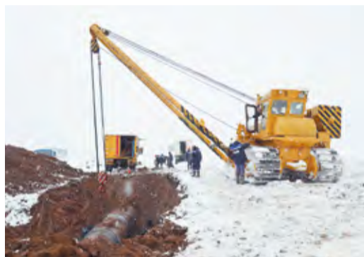
Работы на МГ Уренгой–Новопсков

Перед началом огневых работ проводились энергосберегающие мероприятия по выработке газа из отключенного участка, при этом объем экономии голубого топлива на собственные технологические нужды составил порядка 300 тысяч кубометров.