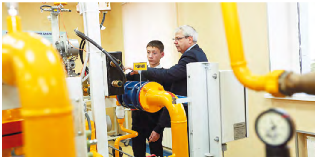
Во время посещения Инженерно-технического центра ООО «Газпром трансгаз Уфа»

Программа рассчитана на два года и предполагает поэтапное знакомство с производственной деятельностью предприятия воспитанников детских домов Уфы, Стерлитамака, Бирска, с. Большой Куганак Стерлитамакского района. В план мероприятий входят экскурсии по Управлению аварийно-восстановительных работ, Управлению технологического транспорта и специальной техники, Кармаскалинскому, Дюртюлинскому и другим филиалам, посещение одной из автогазонаполнительных компрессорных станций г. Уфы, а также тренинги, классные часы, встречи с преподавателями высших и средних специальных учебных заведений. Кроме того, участников проекта ждет комплекс культурно-массовых и спортивных мероприятий. Проект «Будущее вместе» призван помочь детям в профессиональном самоопределении и социальной адаптации, а также в подготовке к дальнейшей работе в газовой отрасли по инженерно-техническим специальностям.