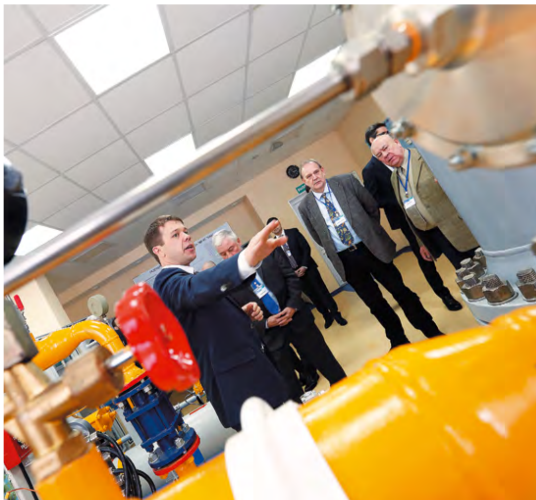
На ГРС Шакиа реализованы все алгоритмы работы в автоматическом режиме

Сотрудничество компании «Юнипер С.Е.» и ПАО «Газпром» началось в 1992 году. На начальном этапе эта масштабная работа включала в себя коррозионные исследования, мероприятия по катодной защите магистральных газопроводов, а также обучающие семинары, в рамках которых около ста российских специалистов смогли повысить свою квалифика-