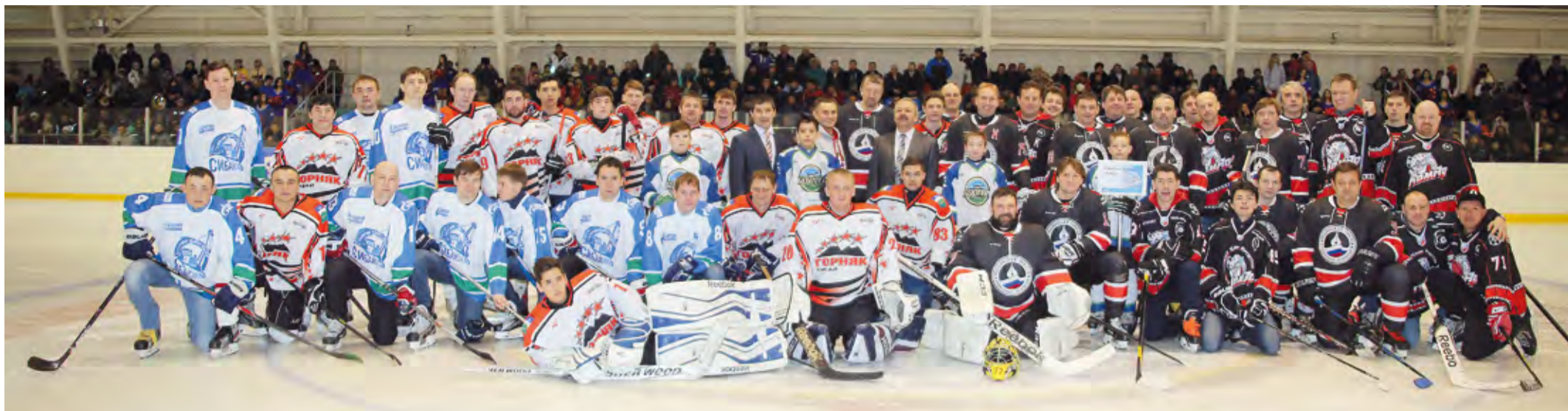
Участники спортивной встречи в Сибее