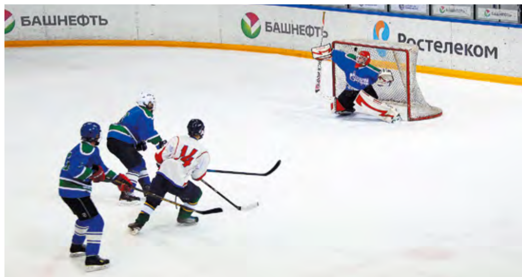
Решающий матч между Кармаскалами и Сибаем