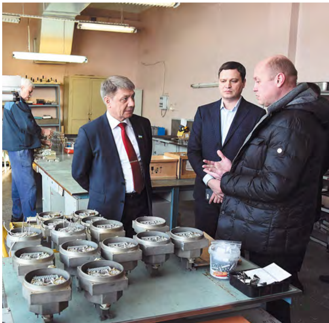
Во время посещения сборочных цехов УППО