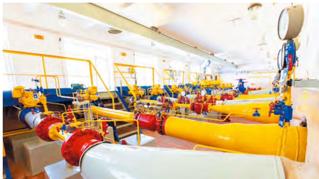
Газораспределительная сеть Республики Башкортостан увеличится более чем на 396 километров