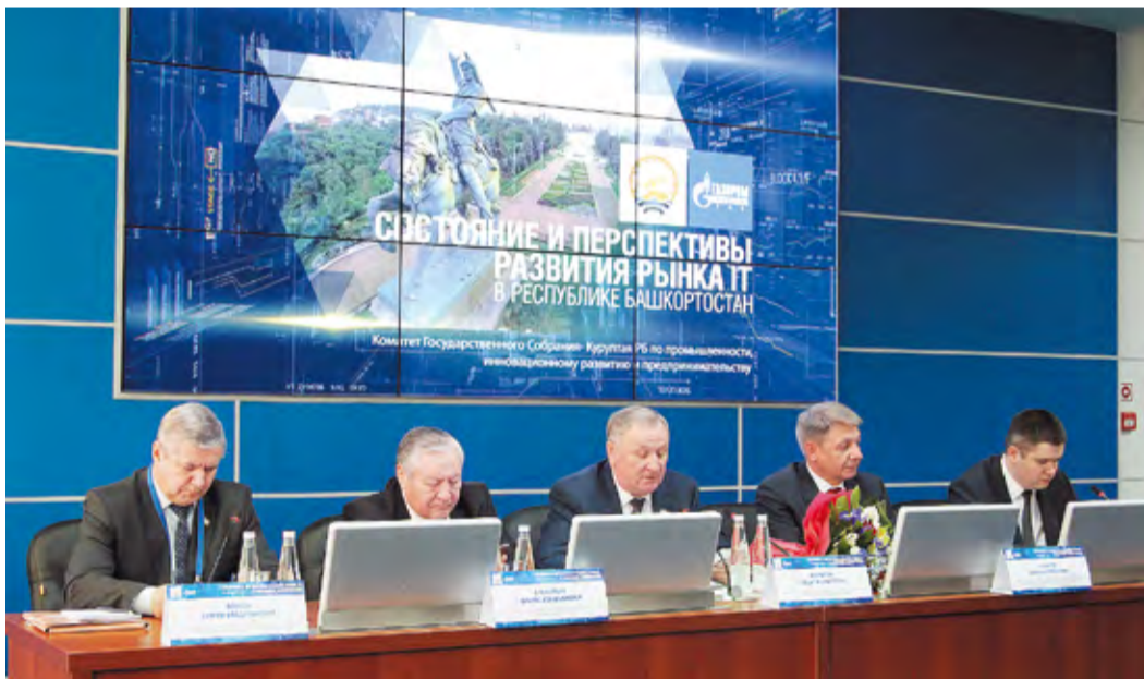
Тема круглого стола вызвала живой отклик у участников встречи

В конце февраля в ООО «Газпром трансгаз Уфа» прошел круглый стол на тему «Состояние и перспективы развития рынка IT в Республике Башкортостан», инициированный комитетом по промышленности, инновационному развитию и предпринимательству Государственного Собрания – Курултая Республики Башкортостан.