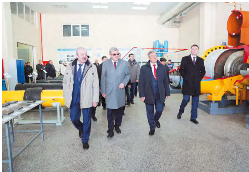
Гости высоко оценили возможности ИТЦ и УПЦ Общества

21 марта в Инженерно-техническом центре ООО «Газпром трансгаз Уфа» прошло совещание руководства ООО «Газпром трансгаз Уфа» с представителями УГНТУ и УГАТУ по вопросам развития взаимодействия в области подготовки кадров.