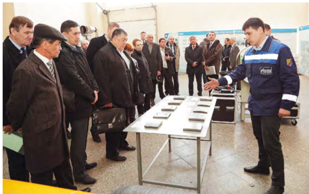
Знакомство представителей высшей школы с потенциалом ИТЦ