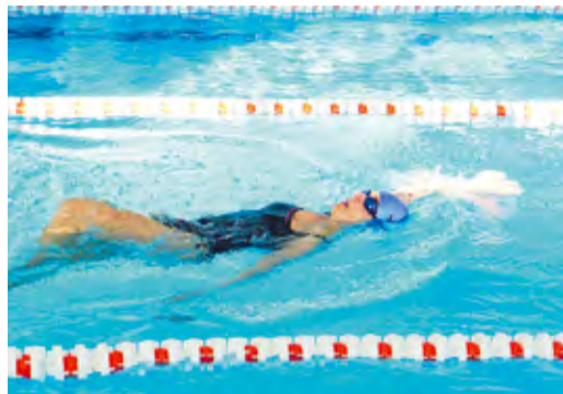
Лучшие пловцы работают в Администрации

В «Газпром трансгаз Уфа» продолжаются соревнования в зачет комплексной Спартакиады предприятия. Победители войдут в пул кандидатов в сборную команду Общества для участия в летней Спартакиаде ПАО «Газпром», которая состоится в сентябре этого года в Сочи.