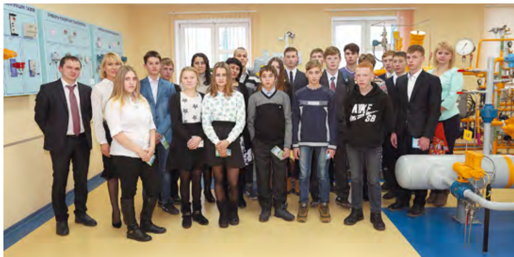
В республиканском проекте «Будущее вместе» участвует 150 детей

Совместная деятельность Министерства образования РБ и ООО «Газпром трансгаз Уфа» в данном направлении стартовала в 2016 году. На начальном этапе состоялся отбор воспитанников из 150 кандидатов для участия в проекте и первое знакомство ребят с производственной деятельностью и социальной политикой ООО «Газпром трансгаз Уфа», включавшее в себя экскурсию по Инженерно-техническому и Учебно-производственному центрам, а также участие в новогоднем представлении в уфимском Конгресс-холле.