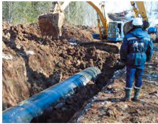
Работы на МГ Челябинск–Петровск

По результатам выборочного контроля на 12 из 14 кольцевых сварных швов выявлены недопустимые внутренние дефекты, подлежащие вырезке. Сроки проведения ремонта ограничивались режимом транспорта газа, а также предстоящим закрытием дорог на период весеннего паводка. Работа выполнялась силами Полянского ЛПУМГ с привлечением специалистов УАВР, Кармаскалинского ЛПУМГ и ИТЦ. Благодаря слаженным действиям персонала работы завершены в установленные сроки, а самое главное, с высокой степенью надежности.