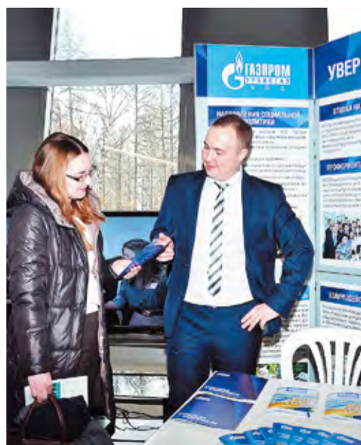
У стенда ООО «Газпром трансгаз Уфа»