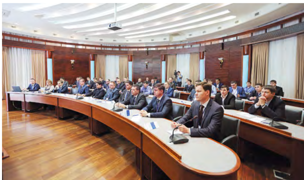
Семинар по проектному управлению – площадка для обмена опытом