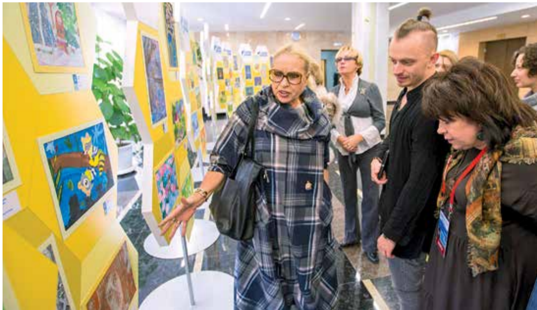
Во время просмотра детских рисунков жюри трудно сдерживать эмоции

Жюри фестиваля подвело итоги конкурса «Юный художник».