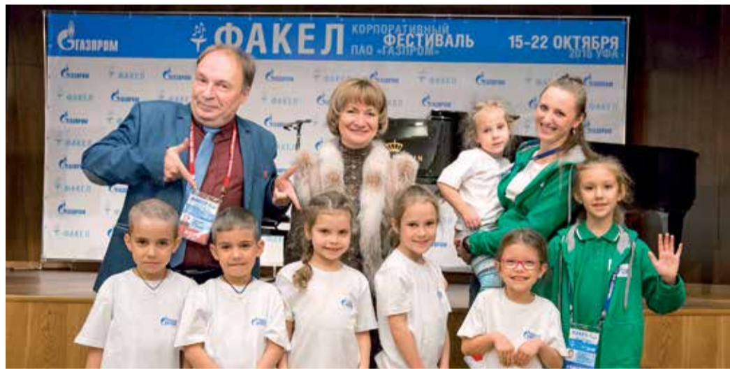
Лекторы не скупятся на рекомендации

На увлекательных мастер-классах своими знаниями, профессиональными находками и секретами с ребятами делятся настоящие мастера своего дела.